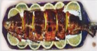
Ձկան խորոված-Grilled fish