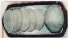
Խեցգետնի գլուխ-Crab meatballs