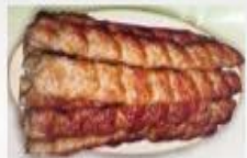
Խեցգետնի քյաբաբ-Crab kebab