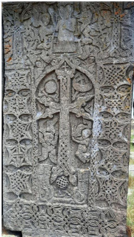
Լուվրում ցուցադրված խաչքար

Սևանը, Մեծ ու Փոքր Մասիսները խորհրդանշող խաչքարեր