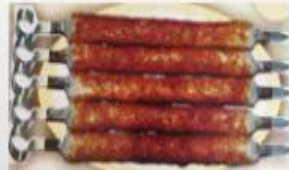
Խեցգետնի քյաբաբ-Crab kebab