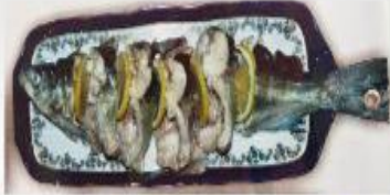
Խաշած սիգ-Boiled whitefish