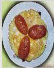
Խեցգետնի կտրուկ-Crab cutlet