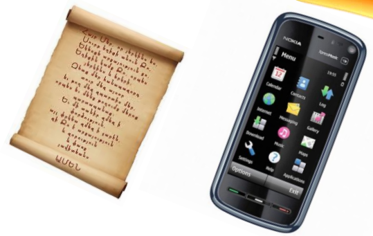
Քայլ 1. Մտագրողի՝ վերնագրերը հետևյալ սահիկը: