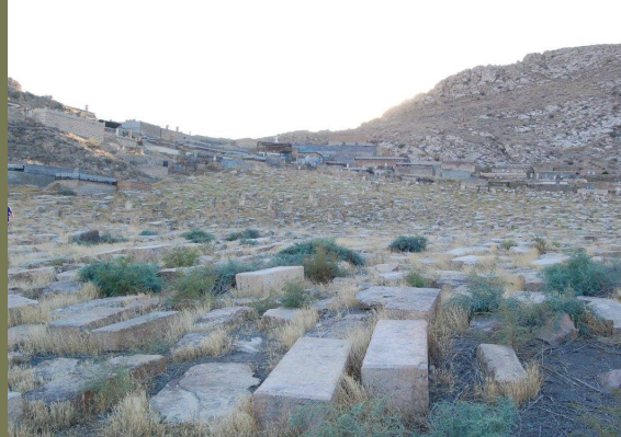
The ancient cemetery of the village

The first name of the village according to the oral sources was Ohanashen then- Martakert .