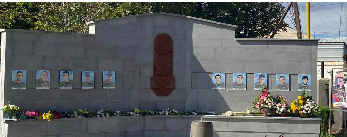
Արցախյան 44-օրյա պատերազմի զոհերին նվիրված հուշապատ