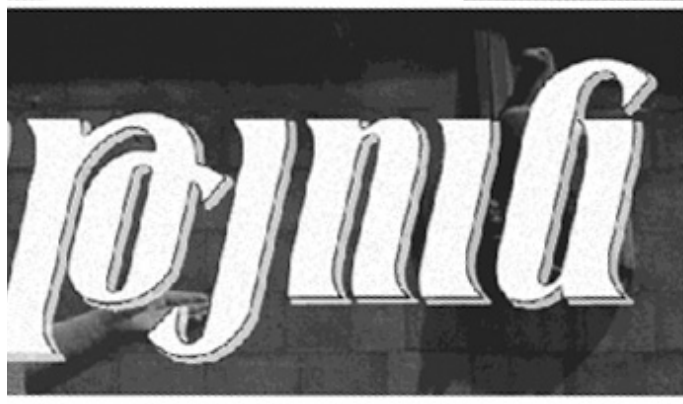
«КрТутун» еженедельник 05.10.2005թ. չորեքշաբթի թիվ 28 (175)

Քանի՞ դար կա այս անցումների միջին... Նախիջեւան-Երեւան-Իջեւան... Ե՞րբ է Նոյն անցել այս ուղերթով...