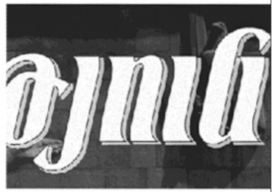
«КрТутун» еженедельник 18.08.2005թ. հինգշաբթի թիվ 21 (111)