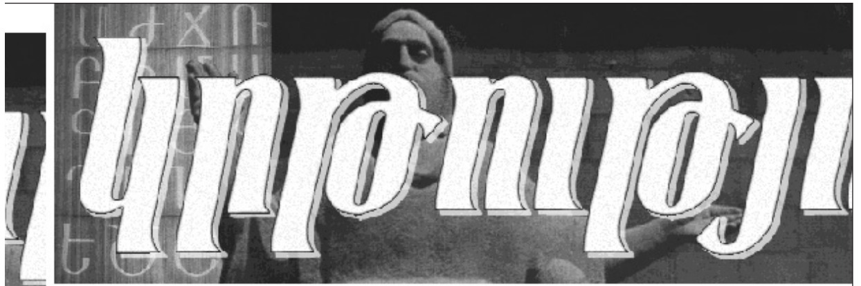
Շաբաթաթերթ «Krtutun» (education) weekly «КрТутун» (образование) еженедельник 12.10.200

Այլ մանրամասնությունների համար կարող եք դիմել «Հայփոստի» (51-45-47), «Հայմամուլի» (45-82-00) եւ այլ գործակալությունների այն մասնաճյուղերին, որտեղ կատարում եք բաժանորդագրությունը: