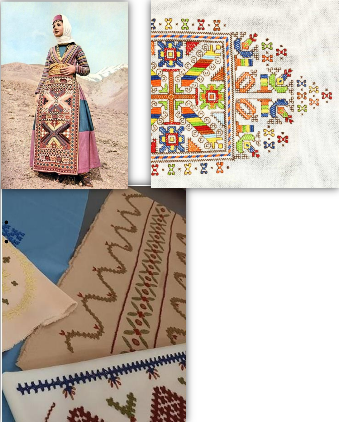
Նկար 1՝ Վան-Վասպուրականի ասեղնագործություն