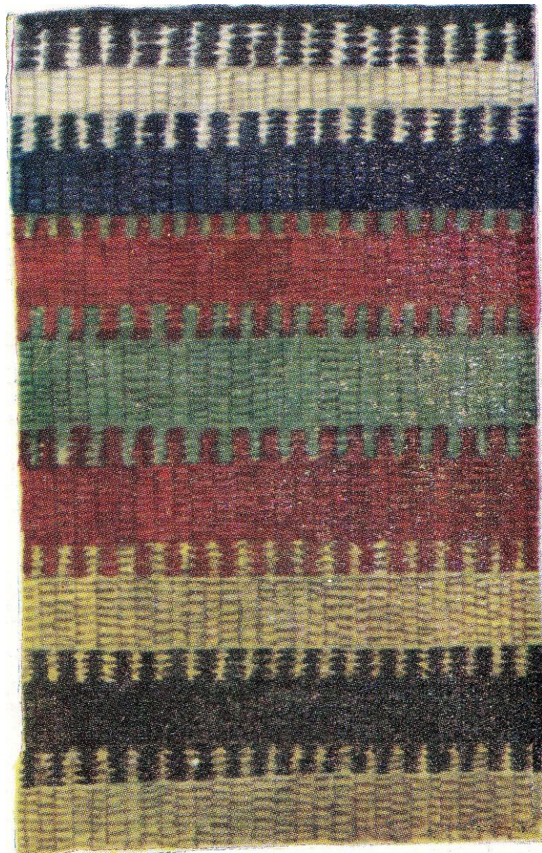
Նկ.2. Կարպետ. Նովար-գուար (Դիլիջան)