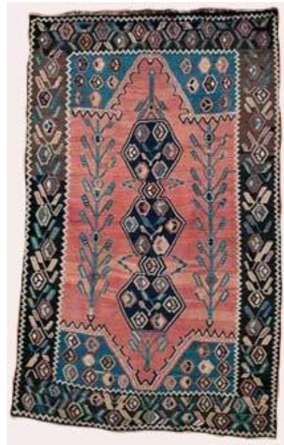
Նկ.11 Կարպետ. Լոռի