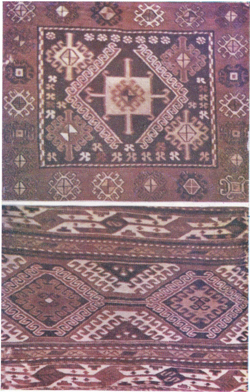
Նկ.4. Կարպետ Լենինականից (սեփ. Ս. Օգնեցյանի)