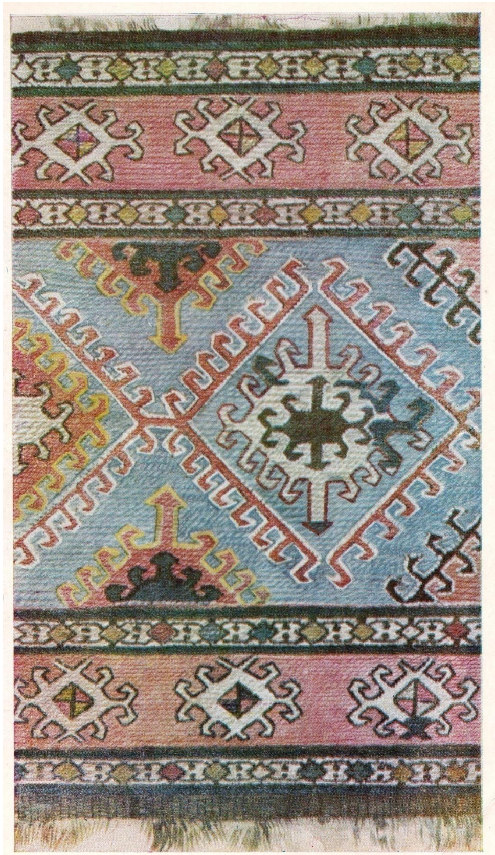
Նկ.8 Անկողնապարկ (Լեռնային Ղարաբաղ)