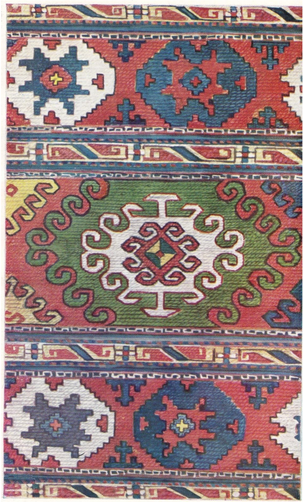
Նկ.7 Անկողնապարկ (Շամշադին.սեփ.Ա.Աթաբեկյանի)