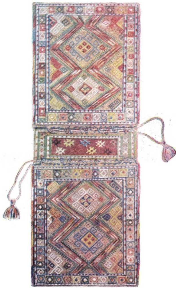
Նկ.6 Խուրջին (սեփ. Օ. վարդանյանի)