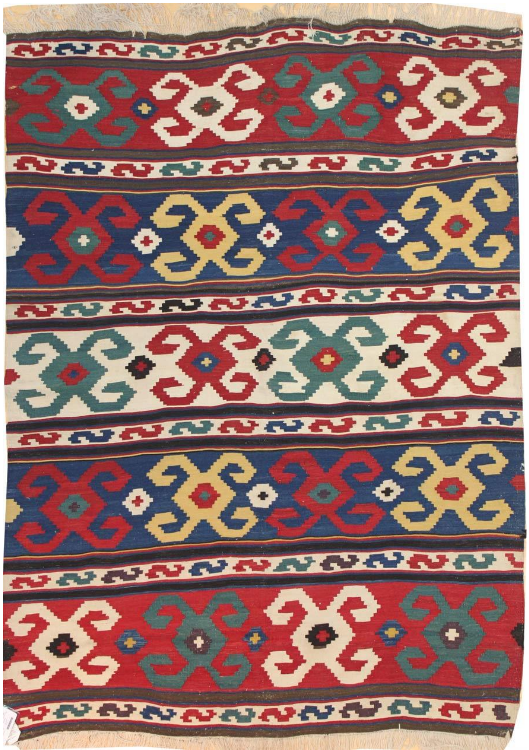
Նկ.1. Կարպետ. Արցախի -Սյունիք