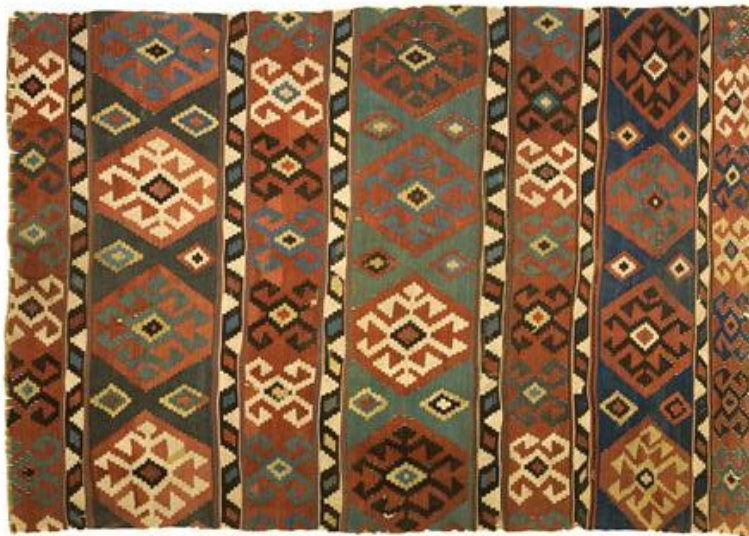
Նկ.12 Կարպետ. Արցախ-Սյունիք