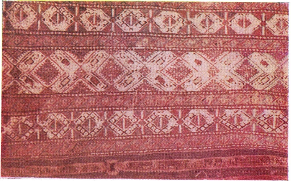
Նկ.5 Կարպետ (Դիլիջան Ա. Ֆրանգուլյանի)