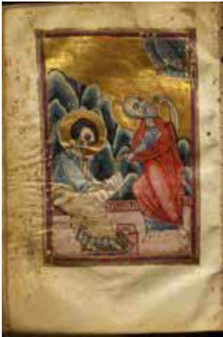
Հովհաննես Ավետարանիչն ու Պրոխորոնը (ՌՊԳ, ֆ. 439.23.5, 14-րդ դար)