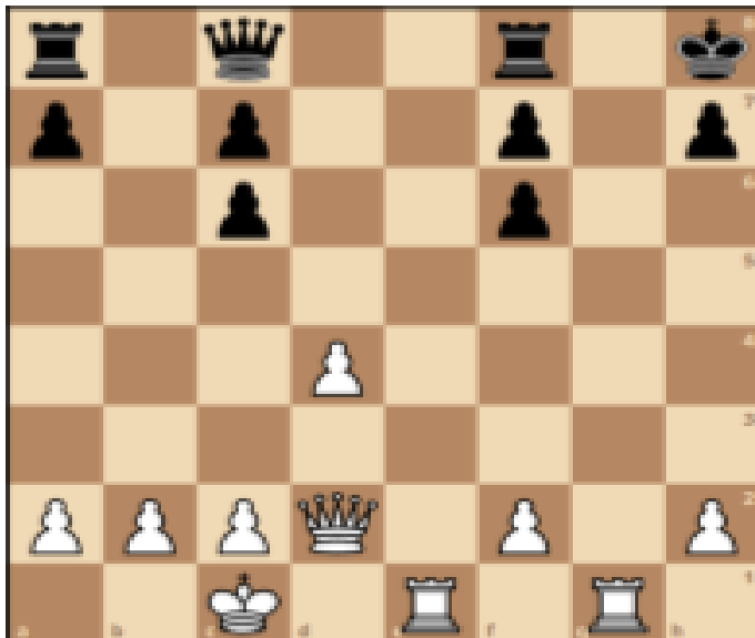
Տրամագիր 1. 4-րդ դասարան, «Դիրքի գնահատում» թեմա [3, 9]

Առարկայի դասավանդման ընթացքում արդյունավետ կիրառվում են լեզվական մտածողությունը և գրագիտությունը զարգացնելու բազմաթիվ մեթոդներ: Այսպիսով շախմատ առարկայի դասավանդման ընթացքում կարևոր դերակատարում է ունենում « Մտագրոհ»-ը: Այս մեթոդիկայի հեղինակն է Ա. Ֆ. Օսբոռնը: Այն դասի մասնակցային սկիզբ ապահովող լավագույն մեթոդներից մեկն է: Մտագրոհի միջոցով ուսուցիչը դասարանից հավաքում է մտքեր տվյալ թեմայի վերաբերյալ: Ընդ որում՝ մտագրոհի ժամանակ կարևոր է մտքերի քանակը: Կարևոր է նաև, որ աշակերտները առանց երկար մտածելու պատասխանեն ուսուցչի հարցին, որպեսզի ուսուցչի համար պարզ դառնան նաև այն սխալ պատկերացումները, որոնք թեմայի վերաբերյալ ունեն աշակերտները: Ուսուցիչն աշակերտներին առաջարկում է թղթի վրա գրել իրենց մտքերը և հանձնել իրեն: Այս մոտեցումը չի փոխարինում բանավոր մտագրոհին 5 : Մտագրոհի միջոցով մենք վեր ենք հանում սովորողների նախնական գիտելիքները տրված թեմայի վերաբերյալ՝ վերլուծելով տրամագիր 1-ը : Հղում ենք մի քանի «բաց» և «փակ» հարցեր: «Բաց» հարցերին պատասխանելու և տարաբնույթ խնդիրներ լուծելու միջոցով սովորողը ձեռք է բերում գիտելիքի, արժեքների, հմտությունների և դիրքորաշուկների հիման վրա ըստ իրավիճակի արդյունավետ ու պատշաճ արձագանքելու ձևեր/կարողունակություններ/: Տրված տրամագրի համար կարող ենք հղել հետևյալ հարցերը.