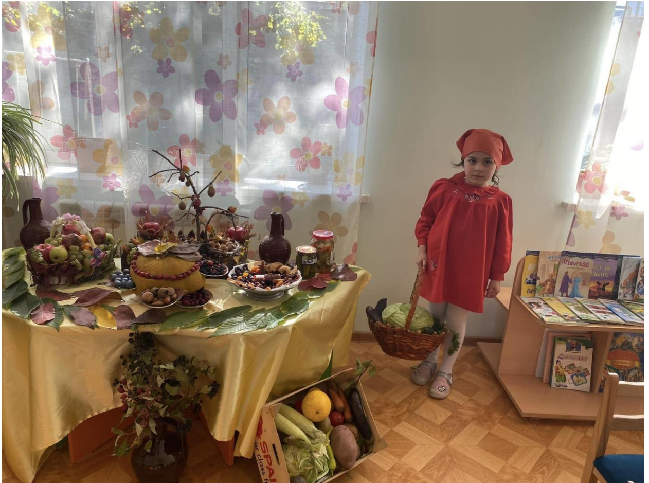
Երգ - «Եկեք ծեծենք սխի ու սխտոր»