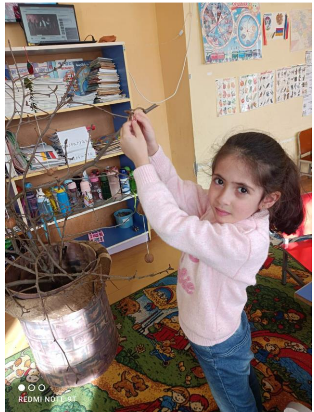
Նկար 3,4,5,6. Ծառի զարդարումը չարխափանով: