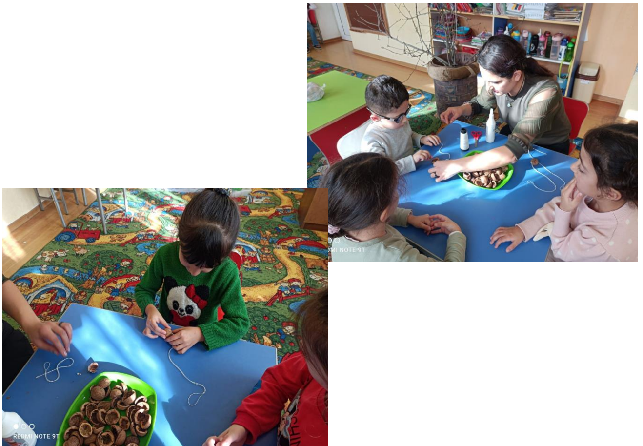
Նկար 1,2. Չարխափանի պատրաստում:

Պատրաստելու ընթացքում ֆիզկուլտ դադար ենք տալիս: Երեխաններին ազգային երաժշտության ներքո խաղում են ընկույզներով խաղը: Երեխաններին բաժանում են 2 խմբի: Յուրաքանչյուր երեխա ձեռքի ընկույզը նետում է իր թիմի գամբյուղի մեջ: Հաղթում է այն թիմը, ով շատ ընկույզ կունենա գամբյուղում: