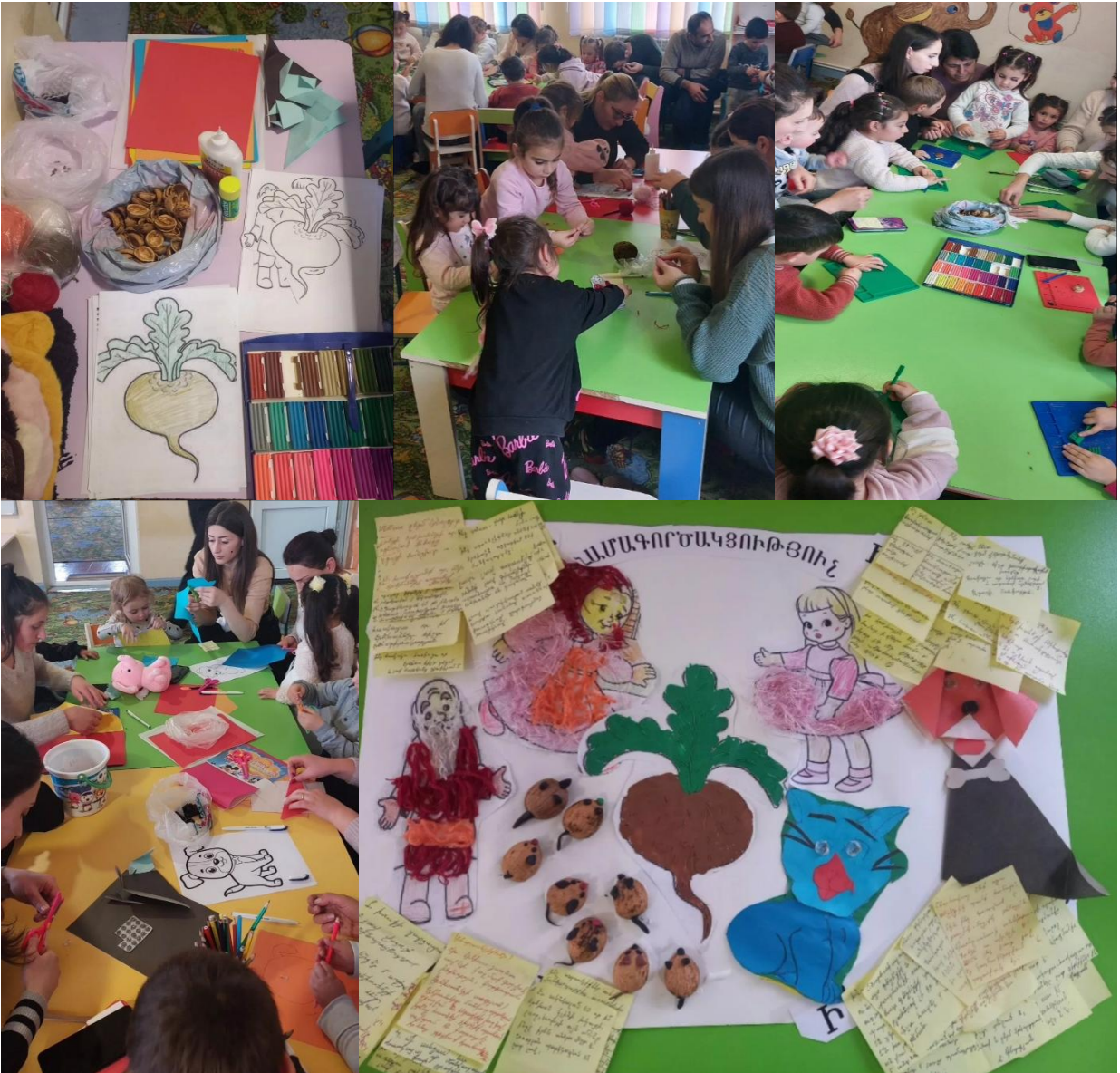
Վերջում կիրառել քառաբաժան մեթոդը ծնողների հետ