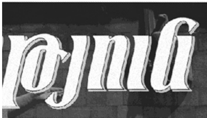
«Крутун» еженедельник 05.10.2005թ. չորեքշաբթի թիվ 28 (175)

Քիչ մի քիչ... Երբեմն-երբեմն... Քանի՞ դար կա այս անցումների միջև... Նախնիքեւան-երեւան-ի ջրեւան... Ե՛րբ է Նոյն անցել այս ուղերթով...