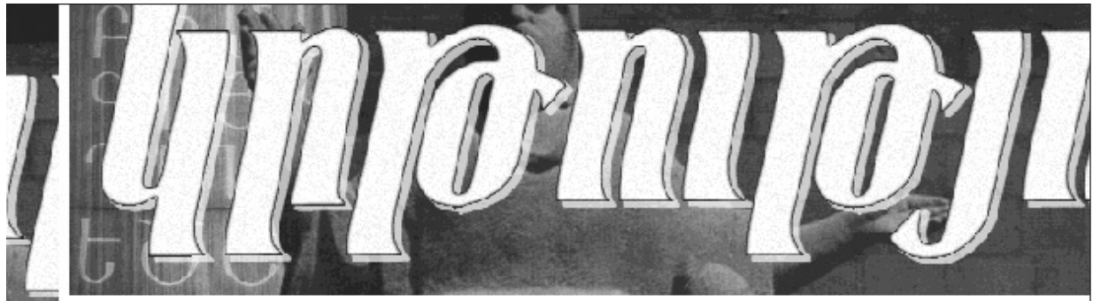
Շաբաթաթերթ «Krtutun» (education) weekly «Крутун» (образование) еженедельник 12.10.2000

Այլ մանրամասնությունների համար կարող եք դիմել «Հայփոստի» (51-45-47), «Հայմամուլի» (45-82-00) եւ այլ գործակալությունների այն մասնաճյուղերին, որտեղ կատարում եք բաժանորդագրությունը: