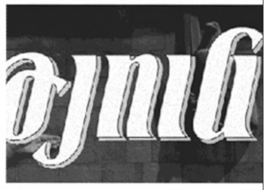
«Крутун» еженедельник 18.08.2005թ. հինգշաբթի թիվ 21 (171)