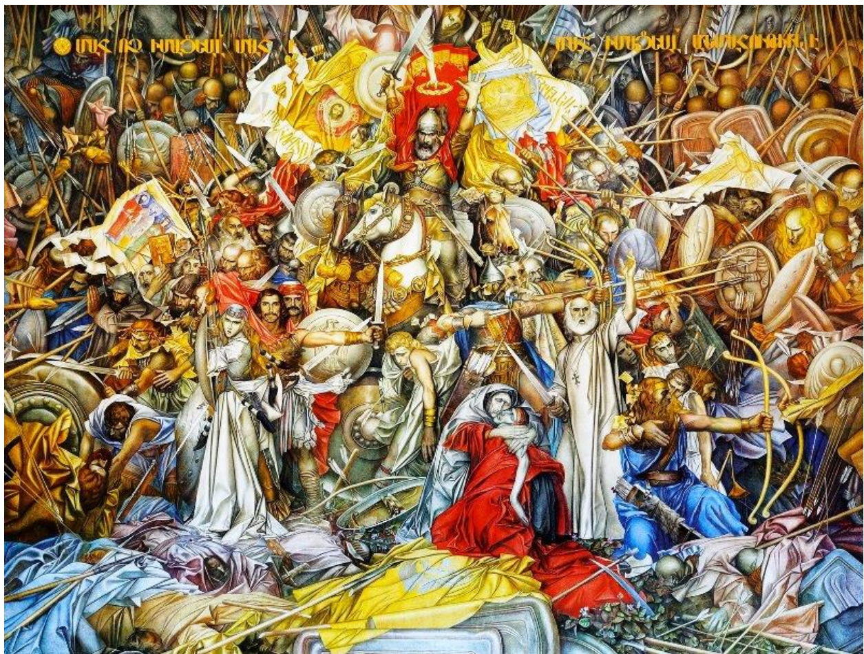
Գր. Խանջյանի «Վարդանանք» գորգանկարը

Քննարկման արդյունքում կգարգանա երեխաների բառապաշարը նոր սովորած բառերով: