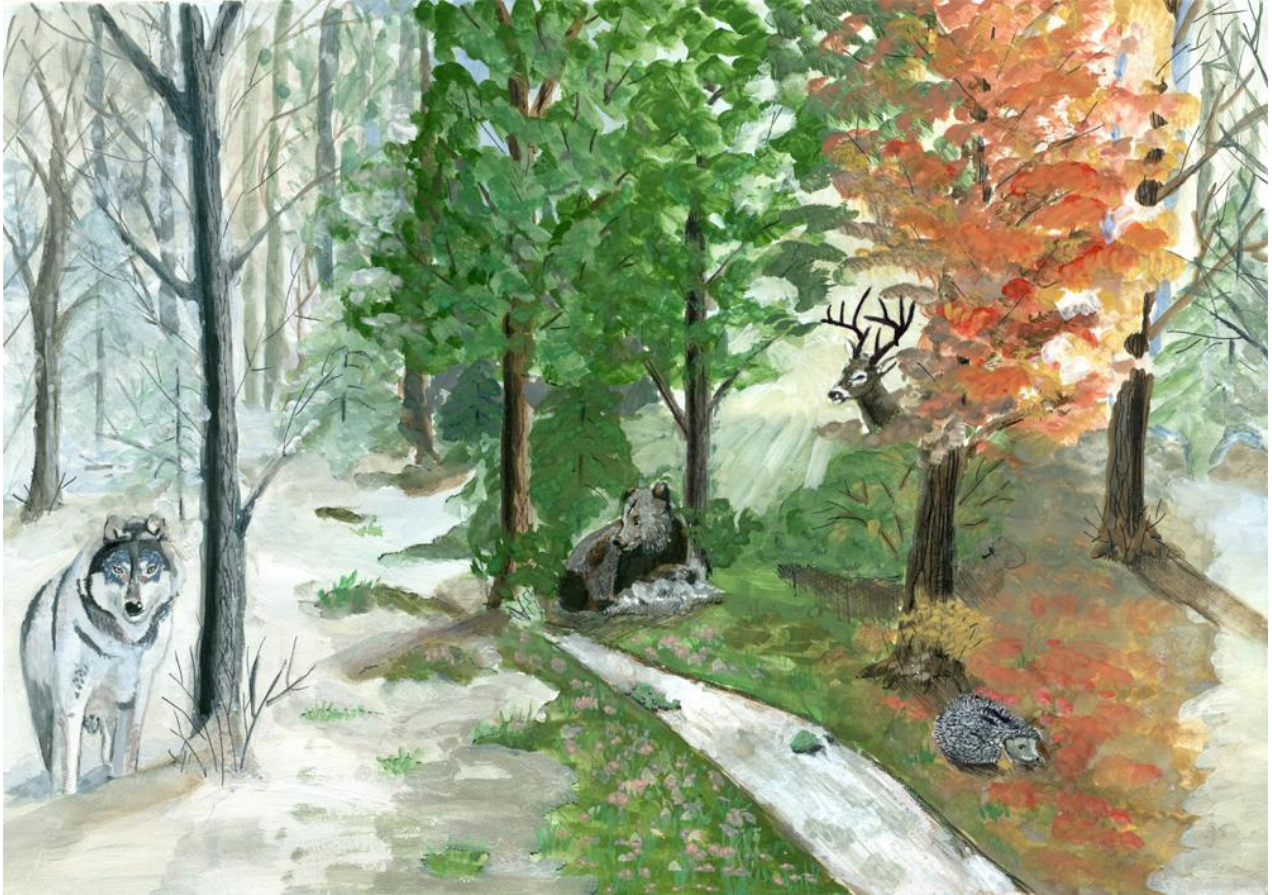
Նկ.2. Տարվա եղանակները նույն վայրում ըստ տարրական դասարանի աշակերտի:

Որպես տարրական դասարաններում սովորող աշակերտների երևակայությունը խթանող հնար, օգտաար է կիրառել նաև գրավիչ, գունազեղ, մուլտիպլիկացիոն մոդելներ, նկարներ, որոնք կվերաբերեն տվյալ օրվա դասին: