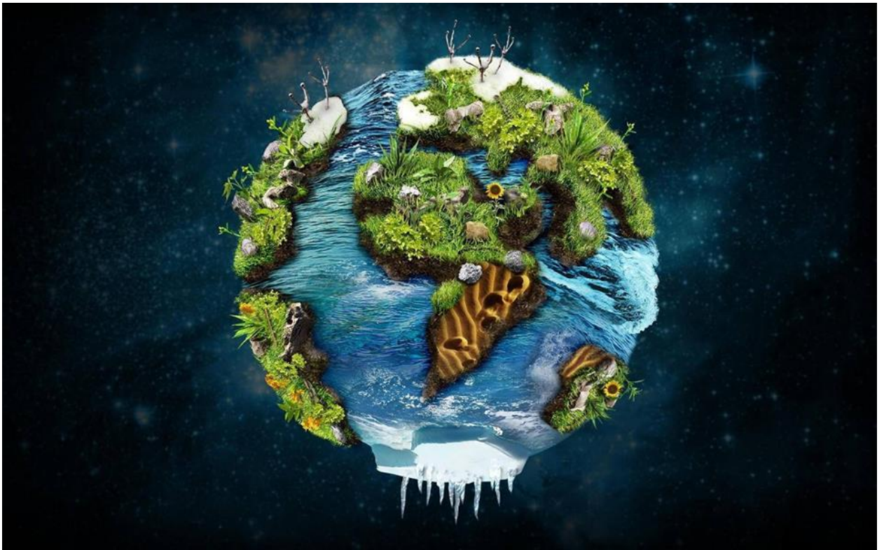
Նկ. 4. Երկիր մոլորակի պատկերը