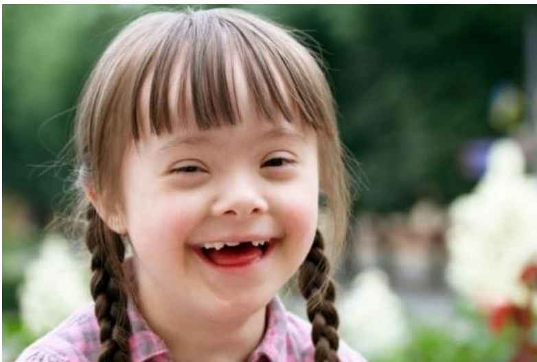
Նկ. 7. Մտավոր հետամնացության համախտանիշ ունեցող երեխա:

Մտավոր հետամնացության պրագայում, աշխարհագրության ուսուցման ընթացքում աշակերտի մոտ երևակայության զարգացմանը նպաստող հնարները տալիս են նվազագույն արդյունք: