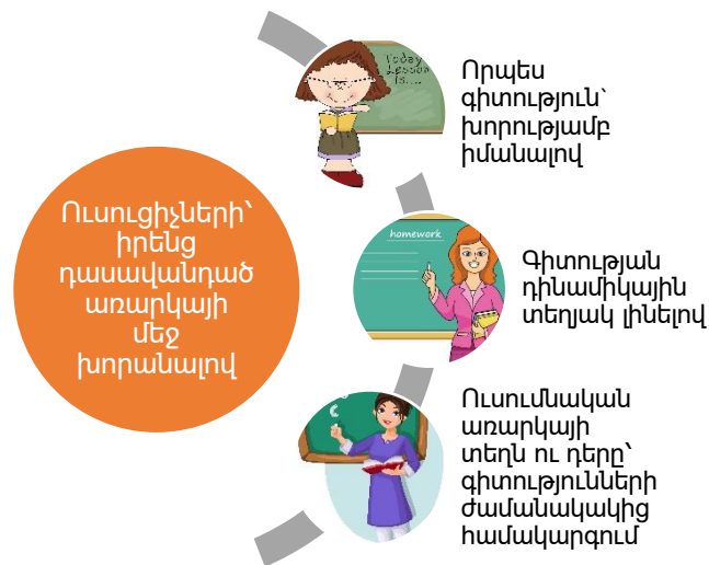
Գծանկար 3. Ուսուցչի գործառույթներն իր դասավանդած առարկայի վերաբերյալ

Առարկայական մեթոդական միավորումները՝ որպես ներդպրոցական վերահսկողության իրականացման գիտամեթոդական միավորում, պետք է հանրակրթության բարեփոխումներն արդի փուլում իրականացնի հետևյալ միջոցառումներով և համապատասխան գործառույթներով.