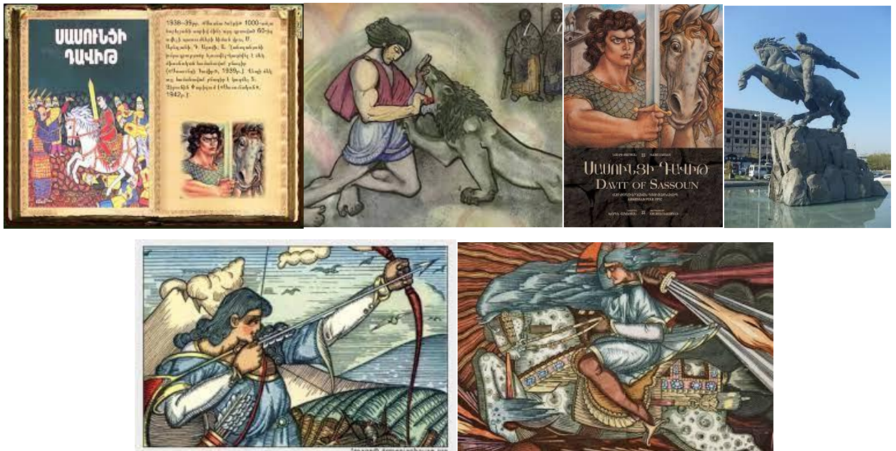
Պատկեր 1-ին. դիդակտիկ նյութերի օրինակներ

1. Դասապրոցեսին ապահովել դիդակտիկ նյութերով.