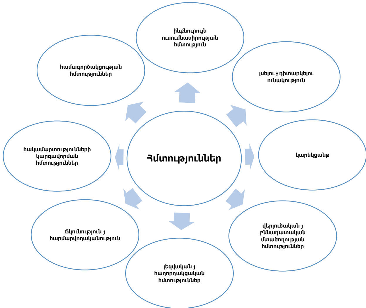
Նկար 2. Եվրոպայի խորհրդի՝ ժողովրդավարական մշակույթի համար կարողունակությունների կողմնորոշիչ շրջանակում ձեռք բերվող հմտություններ 15

կիրառել: 14 Ներկայացված մոդելի արդյունքում աշակերտը պետք է ձեռք բերի հետևյալ հմտությունները(տե'ս նկ.2)