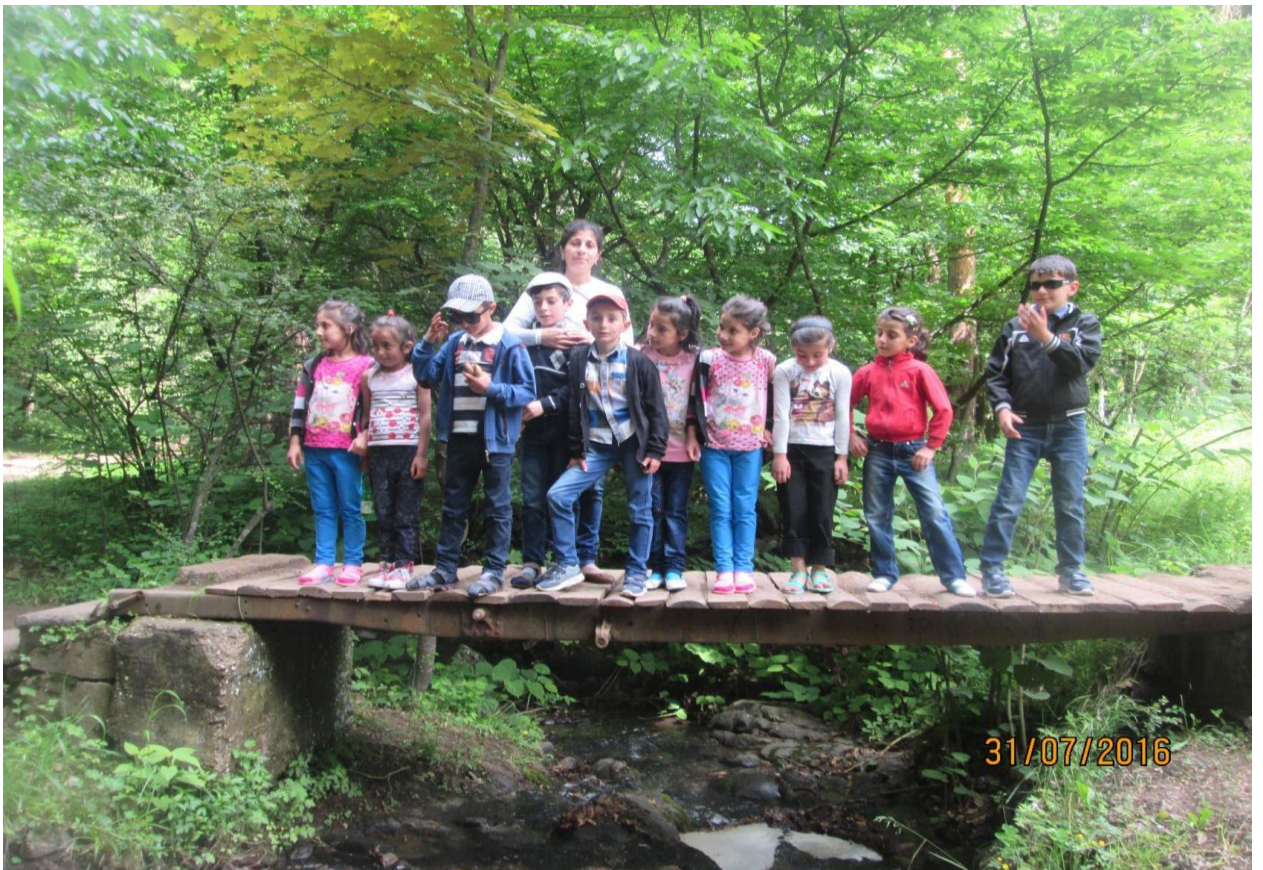
Նկար 3. Աշակերտները դենդրոպարկում