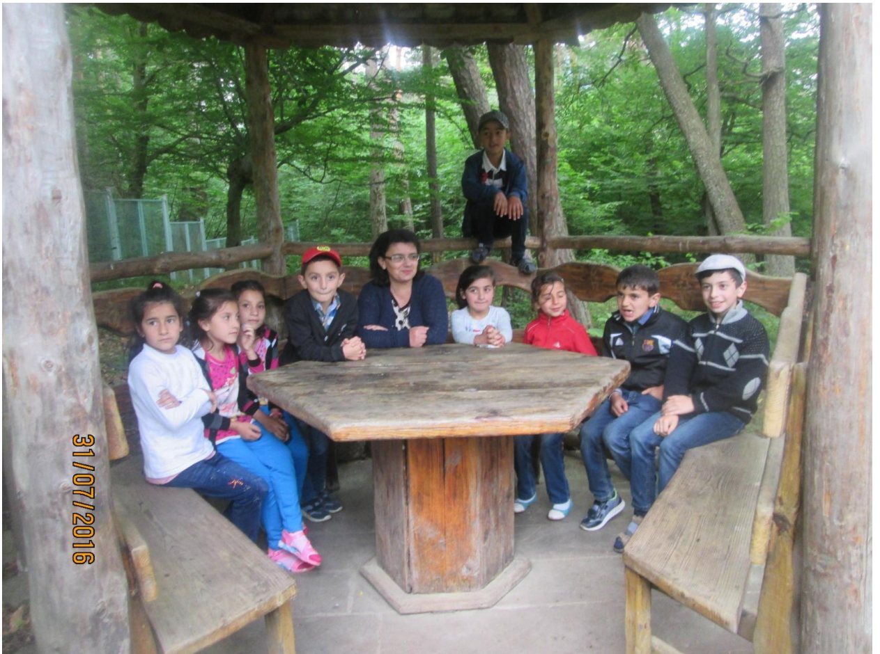
Նկար 2. Բնապահպանական էքսկուրսիա Ստեփանավանի դենդրոպարկ