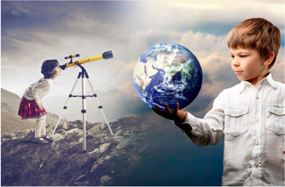
Նկ.2. Բնությունն ամեն ինչի մասին այնպես է հոգացել, որ ամեն տեղ սովորելու բան գտնես