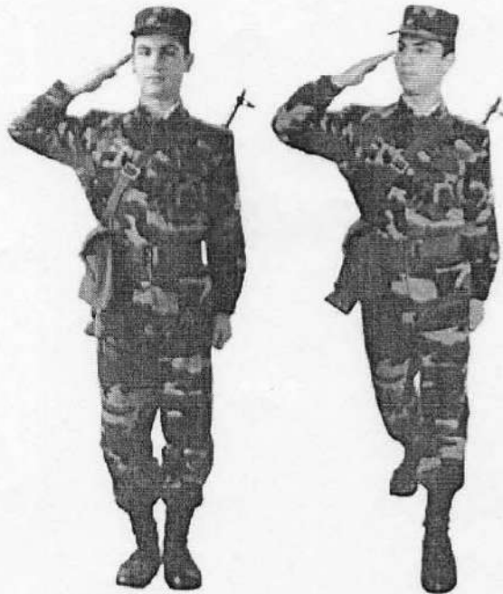
ՕՒՆՆԱԿԱՆ ԺԱՄԱՆԱԿԱՆ ԳԼՈՒԽԸ ԹԵՔԵԼ

զետին դնելու հետ միաժամանակ գլուխը թեքել պետի կողմը, դադարեցնել ազատ ձեռքի շարժումը: