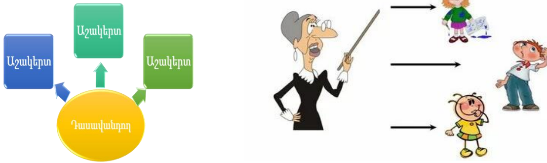
Սխեմա 1. Պասսիվ մեթոդ

Ժամանակ ակից մանկավ արժական տեխնոլոգիան երի և սովորողի կողմից ուսումնական նյութի յուրացման տեսանկյունից՝ ուսուցման պասսիվ մեթոդը համարվում է ամենից անարդյունավետը, սակայն, չնայած դրան, այն ունի մի շարք առավելություններ: Այն ուսուցչից պահանջում է թեթև նախապատրաստական աշխատանք դասին և տալիս է համեմատաբար մեծ ծավալով ուսումնական նյութի մատուցման հնարավորություն դասի սահմանափակ ժամանակահատվածում: Հաշվի առնելով այս առավելությունները՝ շատ դասավանդողներ պասսիվ մեթոդը նախընտրում են այլ մեթոդներից: