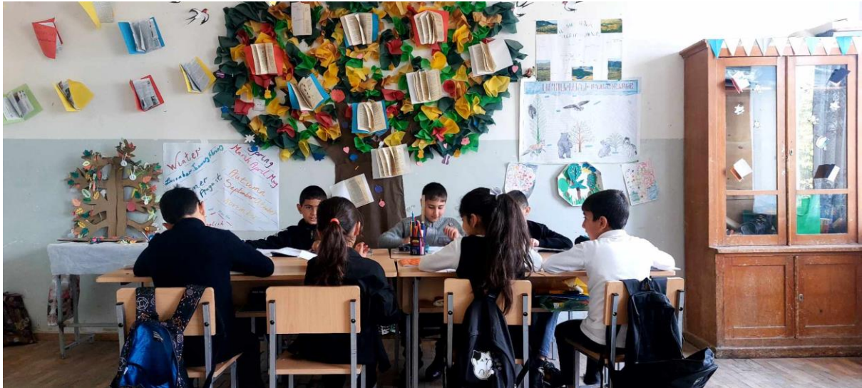
Համաշխարհային սրճարան մեթոդ: