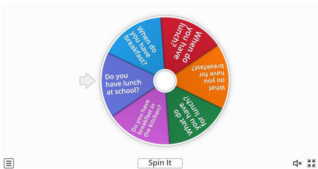
Նկ. 2.2 Առաջադրանք 2-րդ «Random wheel/Պատահական անիվ» 4

Մտածի՛ր-զույգ, կազմի՛ր-հաղորդի՛ր (Think/Pair/Share) մեթոդը կիրառել են 5-րդ դասարանում «The Greedy Hippo» թեմայի յուրացումը համագործակցային մեթոդով իրականացնելու համար: