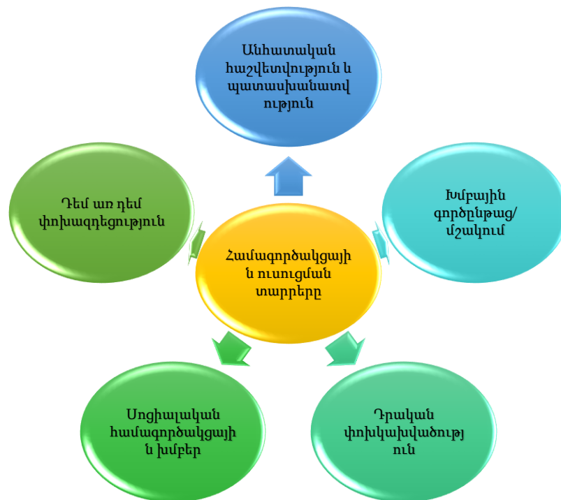
Գծազիր 2. Համագործակցային ուսուցման հիմնական տարրերը 2

Համագործակցային ուսուցման տարրերի կիրառումը նպաստում է դասարանում նոր՝ համագործակցային միջավայրի ձևավորմանը, օգնում է ուսուցչին հասկանալու համագործակցային ուսուցման էությունն ու պլանավորելու դասը, պայմաններ է ստեղծում ուսուցման արդյունավետության գնահատման և արժևորման համար, ինչպես նաև ապահովում է ռեֆլեքսիան և բարելավում է խմբային աշխատանքը: