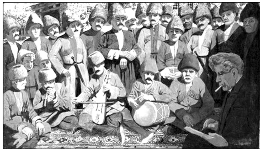
Գրիգոր Շարբաբյան. Ռոմանոս Մեղիթյանը հայկական ժողովրդական երգ գրառելիս

Ցեղասպանությունից տուժած հայերին օգնելու նպատակով 1916թ. Թիֆլիսից հայ մտավորականների մի պատվիրակություն մեկնում է Արեւմտյան Հայաստան Վան քաղաք: Պատվիրակության կազմում էր նաեւ Ռ. Մեղիթյանը: Կոմպոզիտորն ակամատեղ եղավ հայերի նկատմամբ անմարդկային վերաբերմունքին, բայց հենց այդ պայմաններում հաջողվեց ունկնդրել եւ ծայրագրել ժողովրդական երգերի հիմնալի նմուշներ կորստից փրկելով դրանք: