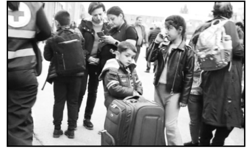
մակերպվել լրացուցիչ կրթական ծառայություններ՝ բաց թողնվածը լրացնելու համար:

- Առանձնահատուկ ուշադրություն է հատկացվելու ավարտական դասարանների սովորողներին՝ վերջիններիս համար հնարավորինս շուտ կրթական գործընթացին միանալու և իրենց հետագա մասնագիտական կողմնորոշման առումով աջակցություն տրամադրելու առումով: Անհրաժեշտության դեպքում նրանց համար կկազմակերպվեն լրացուցիչ կրթական ծառայություններ: