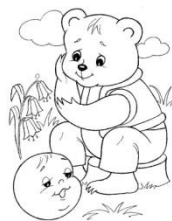
-Երանի՛, Ոսկե բանալին գտնեի: