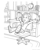
- Ա՛խ, ափսո՛ս, ինչ -