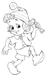
-Ջան, Ոսկե Ռիոն, գնալու բանալին գտա: խաղալու:

Գրատախտակին փակցվում է պաստառ, որի վրա նկարված են զանազան պատկերներ, որոնք արտահայտում են տարբեր զգացմունքներ: Երեխաներին առաջադրվում է նայելով նկարներին երևակայել, թե նրանցից յուրաքանչյուրը ինչ զգացմունք է արտահայտում: Կազմել նկարների բովանդակությանը համապատասխան հնչերանգով նախադասություն: