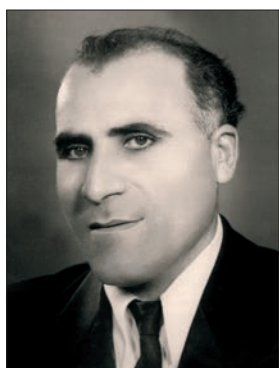
Ավագ Պետրոսյան (1912–2000) Տենոր