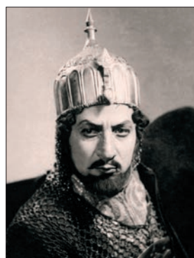
Նար Հովհաննիսյան (1913–1995) Բաս