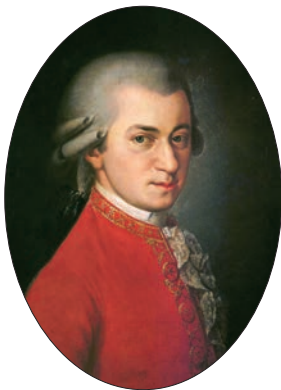
Վոլֆգանգ Ամադեուս Մոցարտ

Համաշխարհային դասական երաժշտության մեծերից մեկի՝ Վոլֆգանգ Ամադեուս Մոցարտի երաժշտությունը սիրելի ու հասկանալի է համայն մարդկությանը: Նրա երաժշտությունն արտահայտում է մարդկային ամենանուրբ զգացմունքներից մինչև ամենահզոր պոռթկումներ: Մոցարտի նրբագեղ և կատարյալ երաժշտության գեղեցկությունն արտացոլում է կյանքի զգացողության խորությունը, մարմնավորում մարդու երջանկության երազանքը: