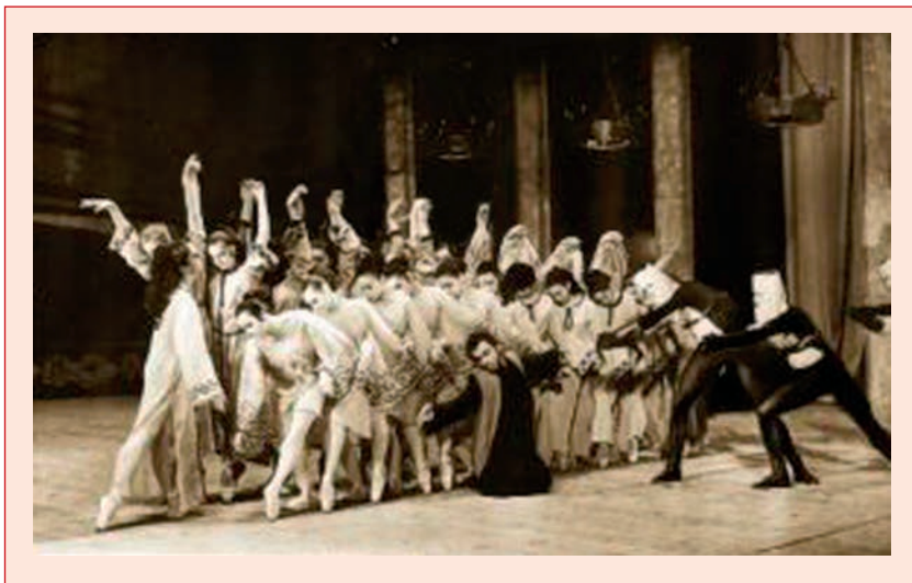
Տեսարան «Անպրունի» բալետից

Բալետում կոմպոզիտորն օգտագործել է Կոմիտասի գրառած և մշակած մի շարք ժողովրդական երգեր և պարեր՝ «Անտունի», «Կռունկ», «Միփանա քաջեր», «Շուշիկի պարը» և այլն: Դրանք ենթարկելով սիմֆոնիկ զարգացման՝ Է. Հովհաննիսյանը կերտել է արտահայտիչ կերպարներ, ստեղծել գեղեցիկ, ազգային երանգով հարուստ, գունեղ երաժշտություն: