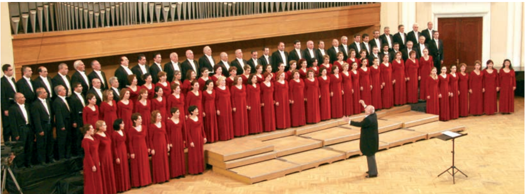
Հայաստանի ակադեմիական երգչախումբը՝ Հովհաննես Չեքիջյանի ղեկավարությամբ

Հ. Չեքիջյանն առանձնակի վերաբերմունք է ունեցել նաև համաշխարհային դասական երաժշտության հանդեպ և իր համերգներում միշտ հնչեցրել է Մոցարտի « Ռեքվիեմը » և Բեթհովենի « 9-րդ սիմֆոնիան »: