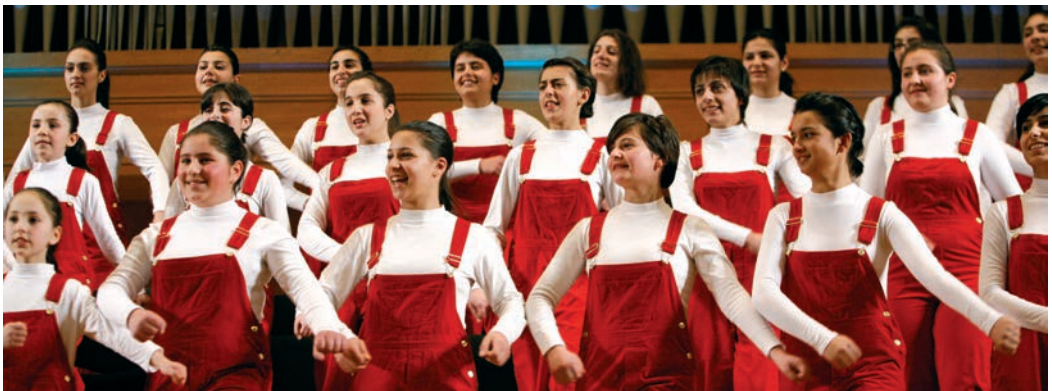
«Հայաստանի փոքրիկ երգիչներ» երգչախումբը

Ունկնդրեք Ջորջ Գերշվինի « Լավ տրամադրություն » երգը «Հայաստանի փոքրիկ երգիչներ» երգչախմբի կատարմամբ՝ Տիգրան Հեքեքյանի ղեկավարությամբ, ապա այդ նույն երգը լսեք «Բիգ-բենդ» ջազային նվագախմբի կատարմամբ՝ Գլեն Միլլերի ղեկավարությամբ: