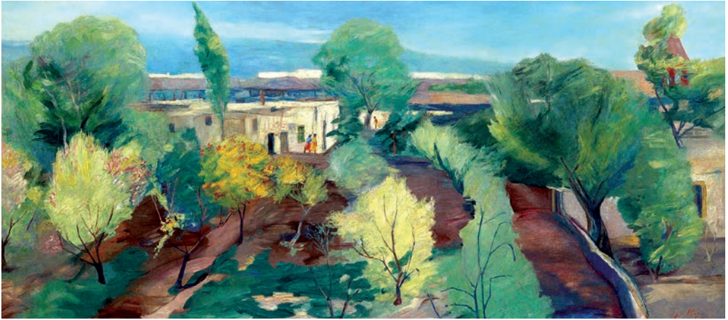
Մարտիրոս Սարյան. «Հայաստան», 1940