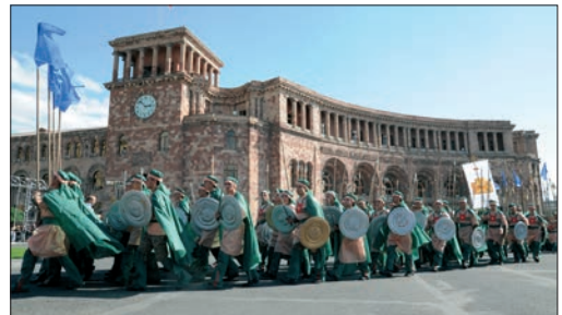
Էրեբունի–Երևան տոնակատարությունը, 2012 թ.