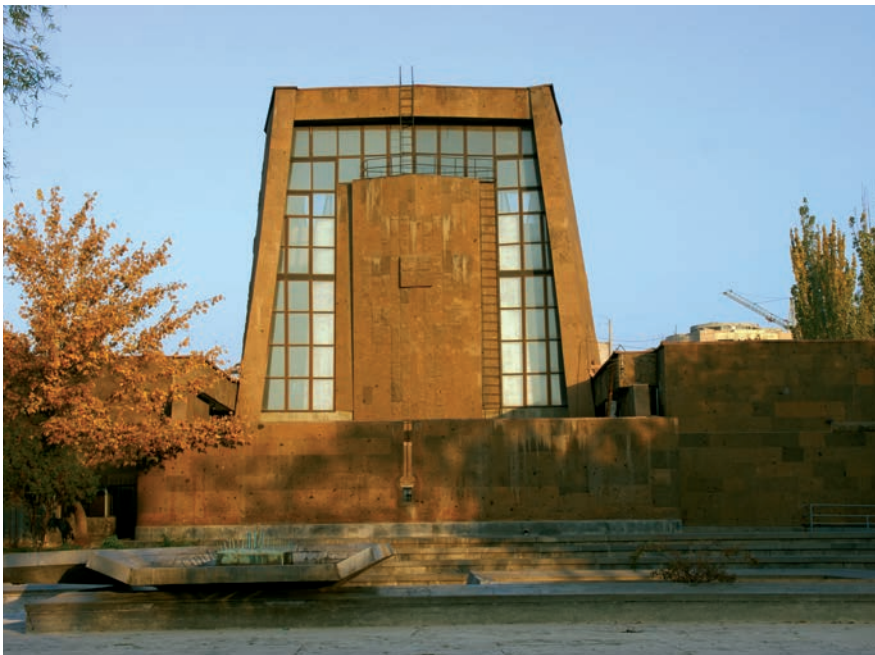
Կոմիտասի անվան կամերային երաժշտության տունը Երևանում

Հուսով ենք, որ երաժշտությունը կշարունակի մնալ ձեր լավագույն բարեկամը: