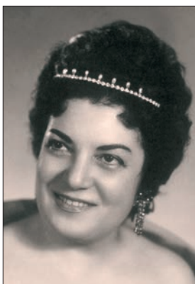
Գոհար Գասարյան (1924–2007) Բարձր սուրանո (կոլորապուրային)