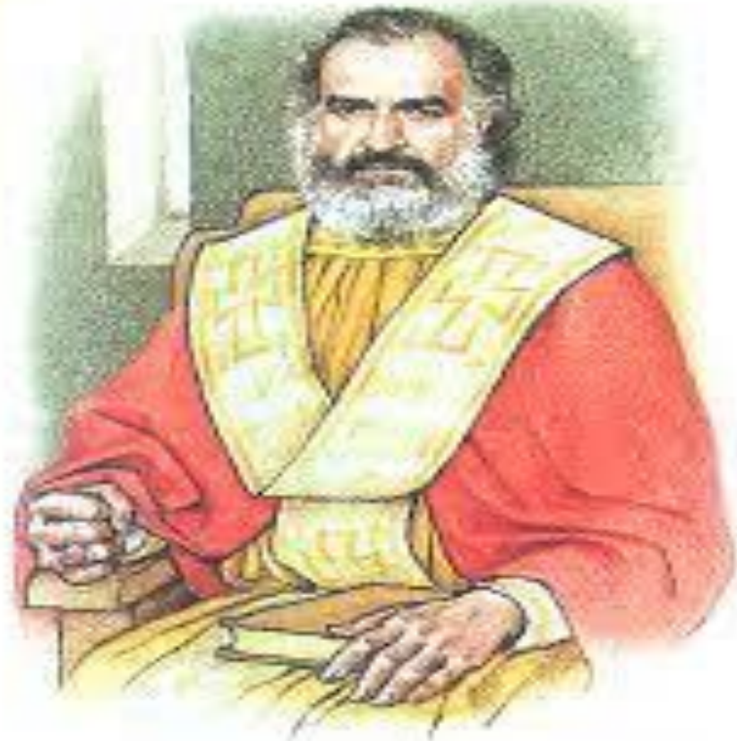
ՄՈՎՍԵՍ Բ ԵՂԻՎԱՐՂԵՑԻ 574 - 604