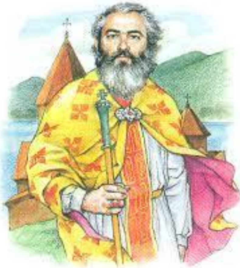
ՄԱՇՏՈՅ Ա ԵՂԻՎԱՐԴԵՑԻ 897 - 898