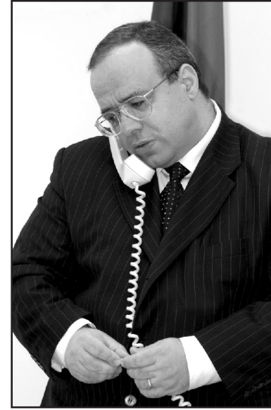
Կային նվիրված գիրք, որի օրինակները, բնականաբար, վերցված են հայկական իրականությունից: Գիրքը պատրաստ է, հուսով եմ, որ այն այս տարի լույս կտեսնի:

- Ես սովոր եմ եղել ամբողջ ուսումնառության ընթացքում միայն գերազանց գնահատականներ ստանալ: Մոսկվայում անվանական թոշակառու եմ եղել: Գենց այսօր դարձել թեկնածու, ապա՝ դոկտոր: Սակայն ուսումնառությունը ինձ համար ինքնամպատակ չի եղել: Նպաստել է իմ մասնագիտական կարողությունների աճին: Իսկ թե ինչպիսի լրագրող եմ, գիտի ընթերցողը, հեռուստադիտողը, ռադիոլսողը: Ասեմ միայն, որ շուրջ 1000 հեռուստահաղորդում եմ պատրաստել, գրեթե նույնքան տպագիր հոդված հրատարակել, ստեղծել մի շարք հեղինակային հաղորդաշարեր, հրատարակել 14 գիրք... Սոռացա մշել հարյուրավոր ռադիոհաղորդումների մասին: 1987 թվականին պաշտպանած իմ թեկնածուական դիսերտացիան, որ նվիրված էր Գալաստանի հեռուստատեսությանը, շուրջ 17 տարի մնաց առաջինն ու վերջինը ոլորտում: Բարեբախտաբար վերջին տարիներին երկու-երեք աշխատանք արդեն պաշտպանվել է: Նաեւ առիթ ունեցա այդ գծով առաջին դոկտորականը պաշտպանել 2004 թվականին: Իմ հրատարակած գրքերի մեծ մասը վերաբերում է հեռուստատեսության պատմությանը եւ առանձնահատկությունների ու զարգացման հեռանկարների ուսումնասիրությանը: Երկար տարիներ առիթ եմ ունեցել դասավանդել Մոսկվայի պետական համալսարանում, Գամաիթենական կինոյի ինստիտուտում, Երեւանի պետական համալսարանում, այժմ դասավանդում եմ Խ.Աբովյանի անվան մանկավարժական համալսարանի կուլտուրայի ֆակուլտետում: Այս տարի ավարտական կուրս ունեմ, արվեստանոցի ղեկավար եմ, փորձում եմ, այն ինչ գրքերում եմ արտահայտում, գործնականում փոխանցել ուսանողներին: Մոսկվայում պատրաստվում եմ հրատարակել հեռուստատեսությանը եւ պրակտի-