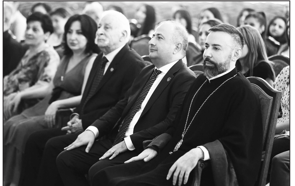
Վերջում Նորին Սրբությունը պատասխանեց շրջանավարտների հարցերին...