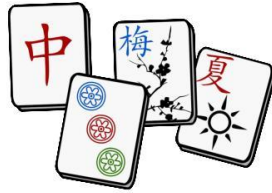
Չինական դոմինո (2800 տարի առաջ)