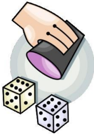
Խաղեր գանի միջոցով (3000 տարի առաջ)