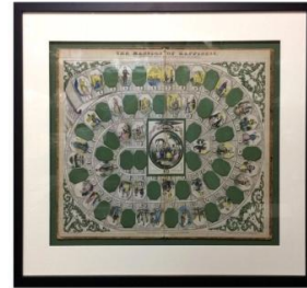
Երջանկության դոյակ (19-րդ դար)

Մարդկային հասարակության զարգացման վաղ փուլերում, երբ արտադրողական ուժերը դեռ պարզունակ մակարդակի վրա էին, և հասարակությունը չէր կարող կերակրել իր երեխաներին, և աշխատանքի գործիքները հնարավորություն էին տալիս ուղղակիորեն, առանց հատուկ պատրաստվածության, իրենց երեխաներին ներգրավել աշխատանքի մեջ: Մեծահասակների մոտ աշխատանքի գործիքների յուրացման հատուկ վարժություններ չկային, էլ չեմ խոսում դերակատարման մասին: Երեխաները մտան մեծերի կյանք, տիրապետեցին աշխատանքի գործիքներին և բոլոր հարաբերություններին՝ անմիջականորեն մասնակցելով մեծերի աշխատանքին: Չարգացման ավելի բարձր փուլում երեխաների ընդգրկումը աշխատանքային գործունեության կարևորագույն ոլորտներում պահանջում էր հատուկ ուսուցում, որը տեղի էր ունենում այն գործիքների վրա, որոնք կրճատվել էին ձևով: Դա խորհրդանշական խաղայիքի նման մի բան էր: Նրա օգնությամբ երեխաները վերստեղծեցին կյանքի և արտադրության այն ոլորտները, որոնցում նրանք դեռ ներառված չեն, բայց որին ձգտում են: Այսպիսով, դերային խաղն առաջանում է հասարակության պատմական զարգացման ընթացքում սոցիալական հարաբերությունների համակարգում երեխայի տեղի փոփոխության արդյունքում: Դերային խաղերի գործառույթները.