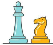
Շախմատ (մ.թ.ա. 6-րդ դար)