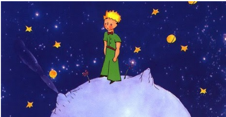
նկար 1. ժ-շ հնչյուններ.

X սովորողի ներկայացրել ենք նկարը և խնդրել պատմել այն, նկարում կան մի շարք բառեր, որտեղ առկա են ջ-ճ-ջ, ժ-շ հնչյունները, իսկ եթե նա փորձել է շրջանցել և սովորում թողնել այդ բառերը, ապա խնդրել ենք բարձրաձայնել, թե ինչ է այս կամ այն առարկան: Օրինակ ժ-շ հնչյուններն ուսուցանելիս ներկայացրել ենք այս նկարը.