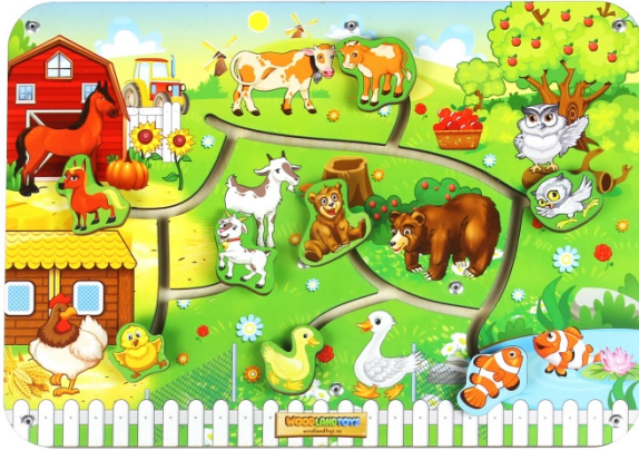
նկար 5. Լաբիրինթ

X սովորողին կարող են օգնել նաև իր դասընկերները և միասին հասնել ցանկալի արդյունքին, նրանց հետ շփման և հաղորդակցման արդյունքում էլ գրանցել ենք որոշակի առաջընթաց: Կիրառելով մի շարք մեթոդներ և հնարներ ուսուցիչն ու լոգոպեդը համագործակցելով ընտանիքի անդամների և դասընկերների հետ , հասել են զգալի արդյունքի: Նա կարողանում է հեշտությամբ արտահայտել ջ-ճ-չ և ժ-շ հնչյունները: