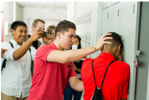
Ֆիզիկական բուլիինգի դրսևորում դպրոցում

Բուլինգի ենթարկվող անձը սովորաբար չի կարող ինքն իրեն պաշտպանել, ինչի համար և ընտրվում է բռնարարի կողմից որպես զոհ: Դրանով է բուլինգը տարբերվում կոնֆլիկտից, քանի որ կողմերը հավասար չեն: