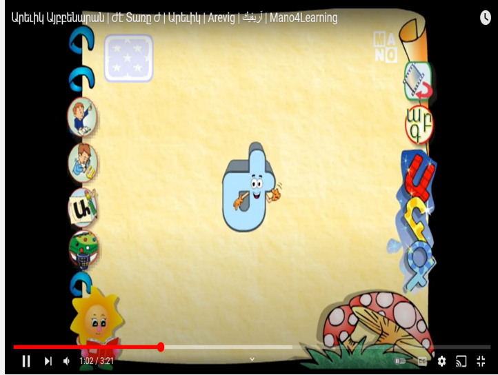
Արագ և ճիշտ կատարված աշխատանքները փակցվում են «Գործնական աշխատանքներ» պաստառի վրա

կատարյալն ու ավելի լավն ուղղորդող հետադարձ կապ