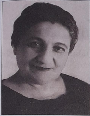
Հայկանուշ Գանիեյան (1893–1958) Սոպրանո