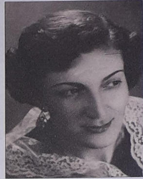
Տաթևիկ Սաղանդարյան (1916–1999) Մեցցո սոպրանո (ալտ)