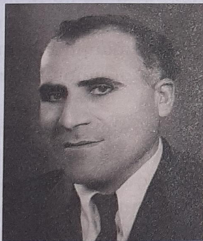
Ավագ Պետրոսյան (1912–2000) Տենոր