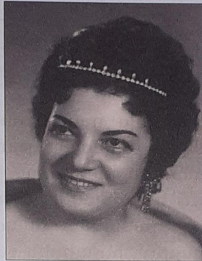
Գոհար Գասարյան (1924–2007) Բարձր սոպրանո (կոլորատուրային)