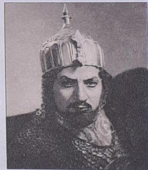
Նար Հովհաննիսյան (1913–1995) Բաս