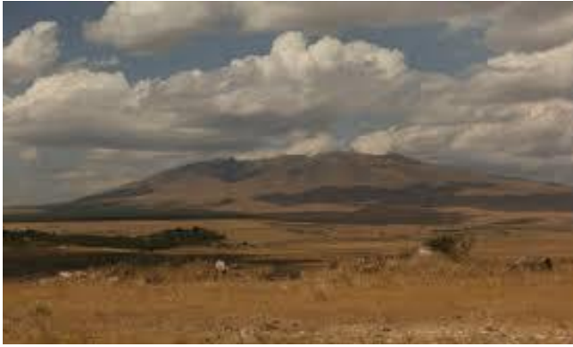
Նկ. 13 Արա լեռը:

Ըստ ավանդության, կոչվել է Հայոց թագավոր Արա գեղեցիկի անունով, որովհետև Ասորեստանի թագուհի Շամիրամի դեմ պատերազմելու ժամանակ նա բնակվել է այս լեռան ստորոտում: Օտար նվաճողները լեռն անվանել են Կառնյարդիս («Ճեղքված փոր». նկատի ունենալով գագաթի հարավային կողմում եղած ճեղքվածքը): Տեղացիներն անվանել են Ծաղկահովիտ: