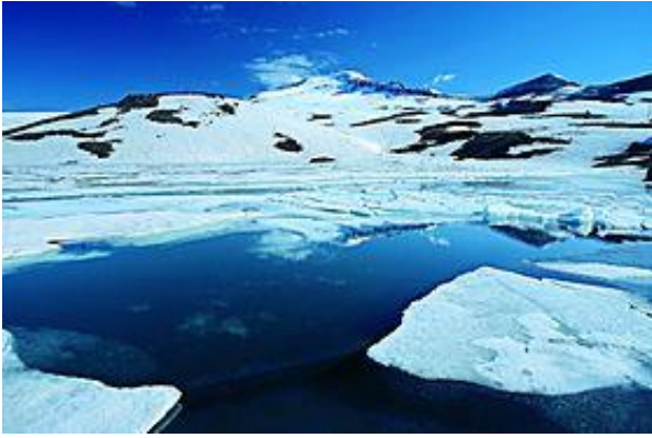
Նկ. 11 Քարի լիճը Արագածի գագաթին:

Լիճը հարուստ է ձկներով: Այստեղ բազմանում է Կարմրախայտը: