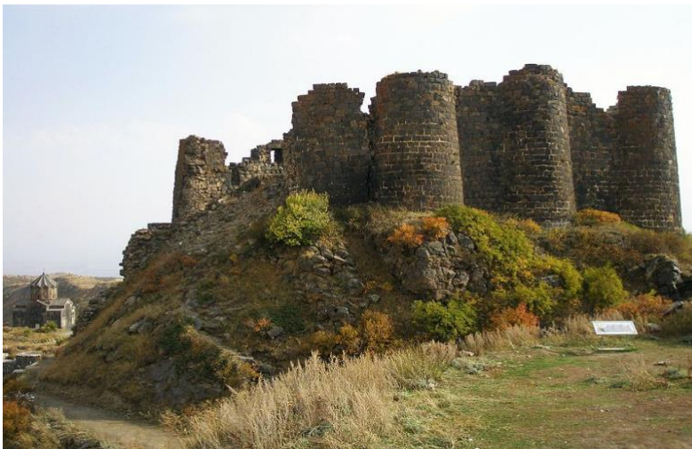
Նկ. 7 Ամբերդը:

Ամբերդ: Բյուրականից 8-10 կմ դեպի հյուսիս Արագածի դաշտահայաց հարավային լանջին է գտնվում միջնադարյան ամրոցներից մեկը՝ Ամբերդը: Գտնվում է Արքաշեն և Ամբերդ գետերի միացման տեղում՝ եռանկյունաձև հրվանդանին, 2300 մ բարձրության վրա: Դոյակը և պարսպի որոշ հատվածներ կառուցվել են VII դարում, Կամսարականների օրոք: (X դար) Ամրոցը պատկանում էր Պահլավունի իշխաններին և Բագրատունիների թագավորության ռազմապաշտպանական կարևոր հենակետերից էր (Նկ.6):