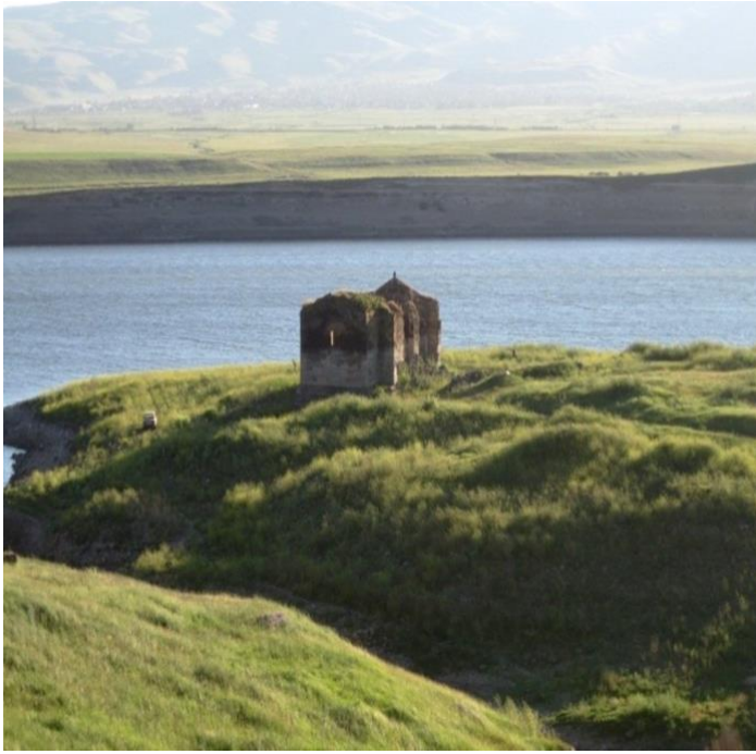
Նկ. 8 Ջովունու Պողոս-Պետրոս եկեղեցին:

Արագածոտնի մարզում շատ են բնական հուշարձանները, որոնցից ամենափառահեղը Արագած լեռն է: