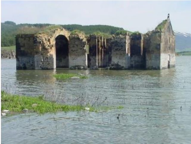
Նկ.12 Ապարանի ջրամբարը:

Ջրամբարը շրջապատված է անտառներով: Նրա շրջակայքում, ինչպես նաև անտառներում բխում են բազմաթիվ աղբյուրներ, այդ շրջանում կան նաև եկեղեցիներ: Ջրամբարի հարմար դիրքը, մաքուր օդը, լեռնային կլիման նպաստավոր են շրջակայքում առողջարաններ հիմնելու համար: 1972թ-ին կառուցվել է Երևան-Ապարանի ջրամբար ավտոմայրուղին (Եղվարդով):