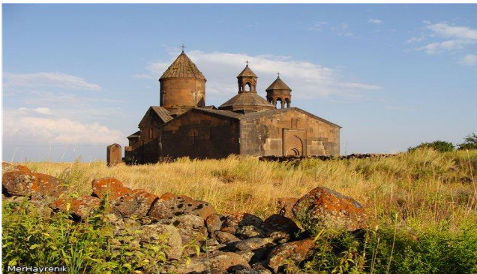
Նկ. 5 Սաղմոսավանքը:

Արտաքինից ուղղանկյուն է, պատերը պարզ են, զուրկ հարդարանքի միջոցներից(Նկ.5):