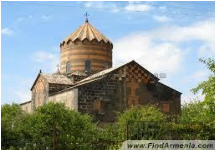
Նկ. 4 Մուղնու Ս Գևորգ եկեղեցին:

Հովհաննավանքը: Օհանավան գյուղը, որը գտնվում է Մուղնուց մի փոքր հյուսիս, իր շրջակայքով հնամենի կոթողների եզակի թանգարան է: Այստեղ Քասաղ գետի կիրճի եզրին է գտնվում նշանավոր Հովհաննավանքը, մի տարածքում, ուր գոյություն ունեն 5-6րդ դարերում միանավ բազիլիկ եկեղեցի: