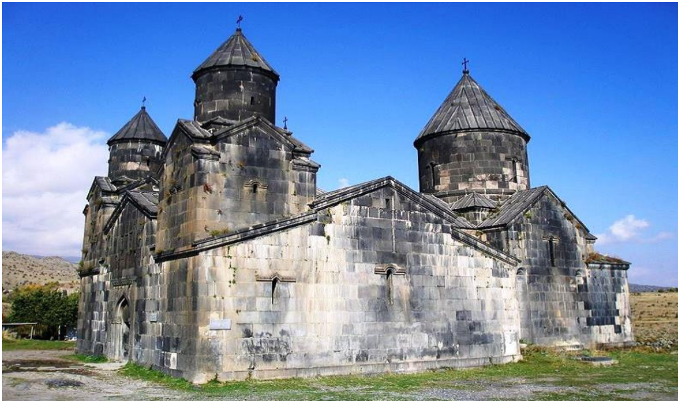
Նկ.6 Տեղերի վանքային համալիրը:

Եկեղեցուն արևմուտքից կից է գավիթը (ըստ սյուներից մեկի վրա պահպանված արձանագրության շինարարությունը տևել է 11 տարի և ավարտվել 1232թ-ին): Այն իր չափերով գերազանցում է եկեղեցուն (Նկ.5):