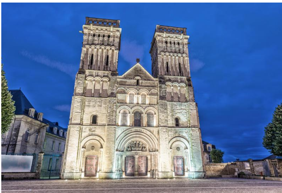
Կանի Սուրբ Երրորդության եկեղեցի, Ֆրանսիա, 1059-1066թթ.