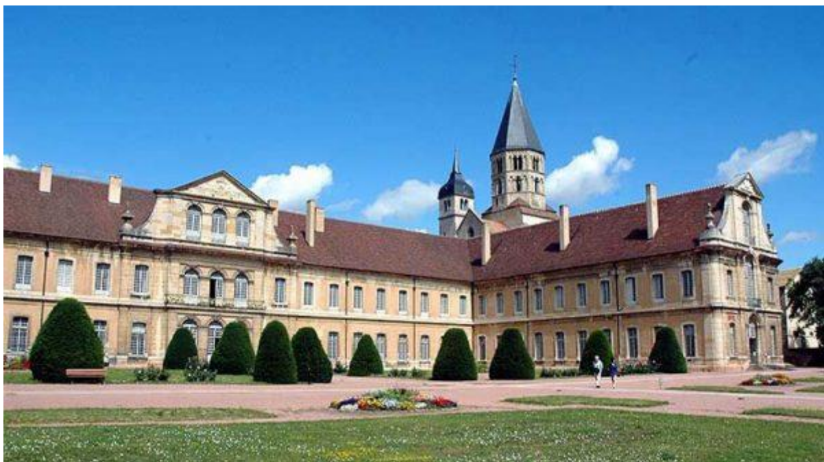
Կլյունի տաճար, Ֆրանսիա, 1088 թ.