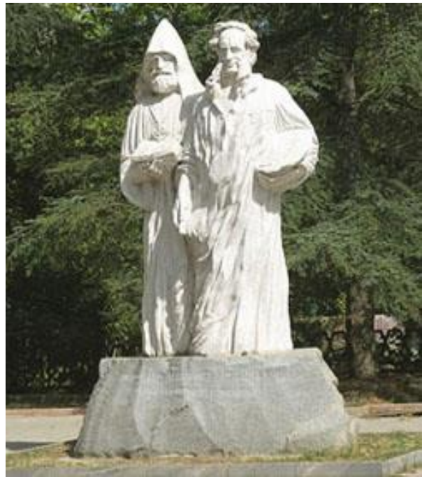
Այվազովսկի եղբայրների հուշարձանը Միմֆերոպոլում

արժանացել Գեղարվեստի ակադեմիայի ակադեմիկոսի կոչման և նշանակվել Ծովային գլխավոր շտաբի գեղանկարիչ: 1845-ից մշտական բնակություն է հաստատել Թեոդոսիայում և այնտեղ կառուցել արվեստանոց: Այվազովսկին եղել է Եվրոպայի, Մերձավոր արևելքի, Աֆրիկայի երկրներում, 1868 –ին ուղևորվել է Կովկաս, 69-ին Թիֆլիսում բացել առաջին գեղարվեստական ցուցահանդեսը: Նա նյութապես օգնել է հույների, իտալացիների ազգային ազատագրական պայքարին: Իր ճանապարհորդությունների ընթացքում օգնել է հայկական ազգային կազմակերպություններին, դպրոցներին, կազմակերպել է ցուցահանդեսներ: Ապաստան է տվել և նյութապես օգնել կոտորածից Ղրիմ գաղթած հայերին: ՆԱ եղել է Ղրիմի հայկական գաղթօջախի հովանավորը: