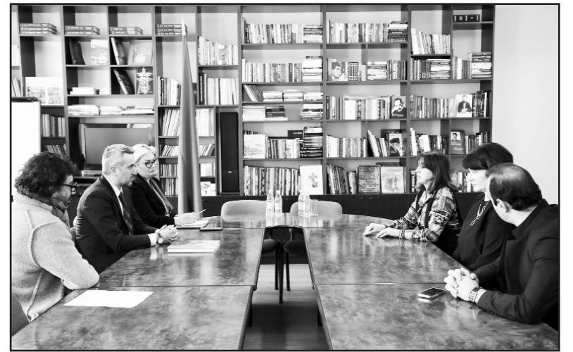
Նիմո Անանիաշվիլին ծանոթացել է թատրոնի եւ բալետային խմբի գործունեությանը, քննարկել համատեղ նախաձեռնությունների հեռանկարները:

Քաղաքացիները եւ շահառու խմբերը մինչեւ փետրվարի 11-ը կարող են նախագծի վերաբերյալ իրենց առաջարկություններն ու դիտողությունները ներկայացնել Իրավական ակտերի նախագծերի հրապարակման միասնական կայքում: