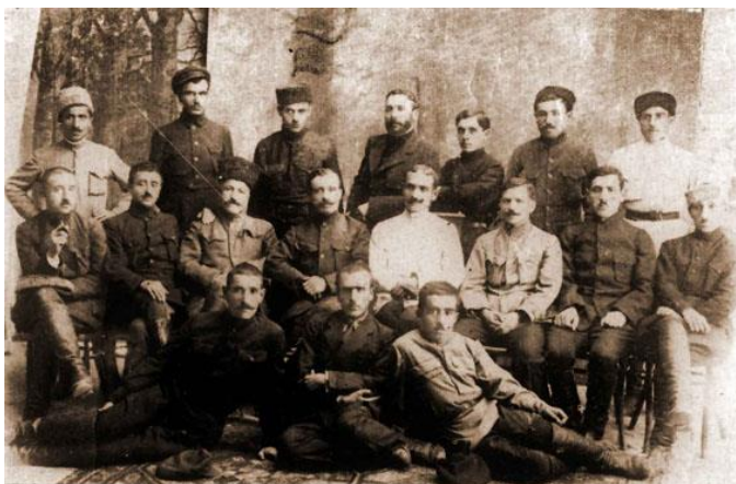
ԲԱՇ - ԱՊԱՐԱՆԻ ԺԱՅԱՏԻ ՀՐԱՄԱՆԱՏԱՐԱԿԱՆ ԳՈՋՄ

Մայիսի 25-ի վաղ առավոտյան հայկական ուժերը Դրոյի գլխավորությամբ հարձակման անցան թուրքական ուժերի դեմ: Դրոն սրընթաց գրոհով հասավ մինչև Ղոնդաղսազ ու գրավեց այն, սակայն հենց հաջորդ օրը շրջափակման մեջ ընկնելու վտանգից ելնելով՝ ստիպված եղավ նահանջել: Միայն Ղոնդաղսազ գյուղի մոտ թուրքերը կորցրին 30 զինվոր և մեկ սպա: Մայիսի 25-26-ի մարտերից հետո հարաբերական դադար հաստատվեց, որի ընթացքում Դրոյի ջոկատը զգալիորեն ուժեղացվեց: