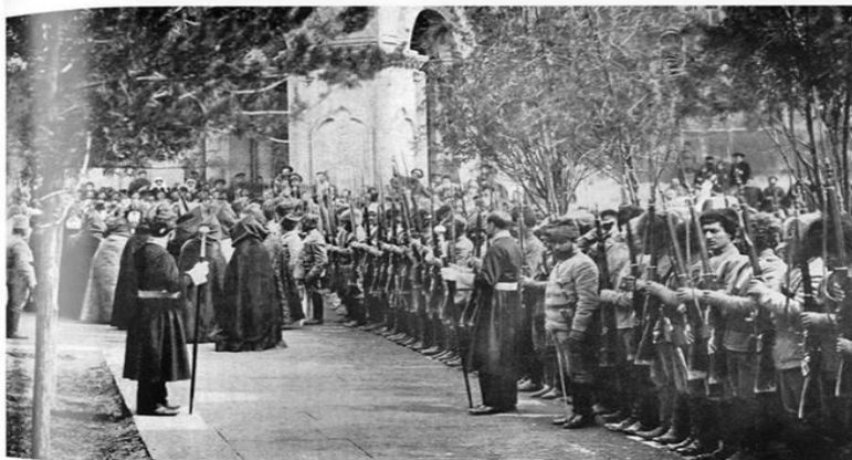
ՎԵՆՉՓԱՆ ԿԱԹՈՂԻԿՈՍԸ օրհնում է կամադրեկին. ЕГО СВЯТЕЙШЕСТВО КАТОЛИКОС благословляет армян-добровольцев. SA SAINTETE LE KATHOLIKOS benit les volontaires arméniens.

Գևորգ Ե-ն կոչով դիմում է հայ ժողովրդին՝ ոտքի կանգնել ու պաշտպանել հայրենիքը. «Ա՛գգ հայոց, թուրքը՝ մեր բանական հոտի դարավոր թշնամին, նվաճել է Ալեքսանդրապոլը, շարժվում է դեպի սիրտը մեր երկրի, մեր հավատի, մեր կենսագրության: