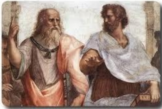
Աթենական դպրոցի հիմնադիրները՝ Արիստոտելը և Պլատոնը

Հիմնականում մասնագիտությանն առնչվող գիտելիքների, կարողությունների և ընդունակությունների որոշման միջոցով: Դա է վկայում մ.թ.ա. 3-րդ հազարամյակում հին Բաբելոնում գրագիրներ պատրաստող դպրոցներ ավարտողներն անցնում էին լուրջ փորձությունների միջով. Այդ պատճառով էլ գրագիրները լուրջ մասնագիտական պատրաստվածության շնորհիվ համարվում էին կենտրոնական կերպարներ : Նրանք կարողանում էին չափել տարածությունը, բաժանել ունեցվածքը, երգել, նվագել երաժշտական գործիքների վրա: Փորձությունների ժամանակ ստուգվում էր նրանց կտորեղենի, մետաղների, բույսերի տեսակների ճանաչողությունը,