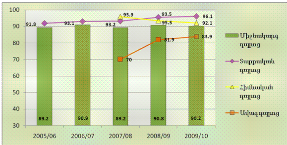
Գծապատկեր 1. Համախառն ընդգրկվածությունը հանրակրթության համակարգում, %

Հայաստանում հանրակրթության մեջ ընդգրկվածության էական խնդիր չկա: Համեմատական առումով համախառն ընդգրկվածությունը միջնակարգ կրթությունում բավականին բարձր է. վերջին տարիներին այն միջինում կազմել է մոտ 90%: Հիմնական կրթության համակարգում ընդգրկվածությունը 2009 թ. կազմել է 92.1%, որը միատարր է տարածքային, գենդերային ու աղքատության խմբերի առումով, և այս իմաստով էական անհավասարություններ չկան: Մինևույն ժամանակ, ավագ դպրոցում համախառն ընդգրկվածության ցուցանիշը զգալիորեն ավելի ցածր է՝ 2009 թ. 83.9% (տե՛ս գծապատկեր 1): Սակայն անհրաժեշտ է հաշվի առնել, որ հիմնական կրթությունից հետո սովորողների մոտ 10%-ն ուսումը շարունակում է նախնական և միջին մասնագիտական կրթության ոլորտում: Այսինքն, ավագ դպրոցում ընդգրկվածության ցածր մակարդակը դեռևս չի նշանակում, որ սովորողների զգալի մասը հիմնական դպրոցից հետո դուրս է մնում կրթությունից: Այլ խնդիր է, թե սոցիալական որ խմբերի երեխաներն են շարունակում կրթությունն ավագ դպրոցում, այսինքն՝ հավակնում կրթության ավելի բարձր մակարդակի: