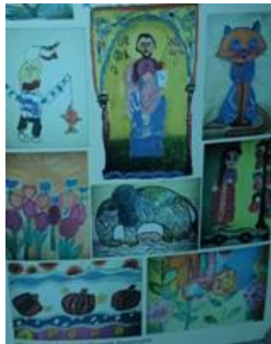
Նկար 3 Չարգացնել երեխայի մոտ գեղագիտական ճաշակ: