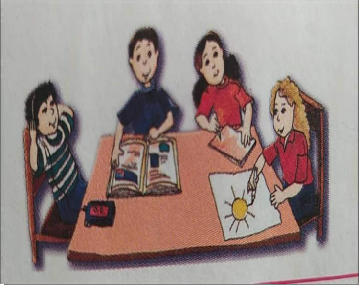
Նկար 1. Խմբային աշխատանք: