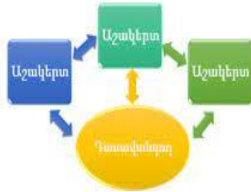
Մյենա 3, Ինտեգրացիոն մոդել