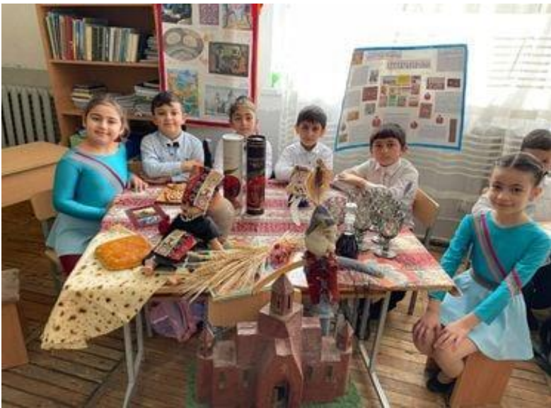
Հավելված 3 (սկար 4,5)