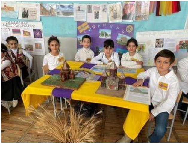
Հավելված 1(նկար 1,2)