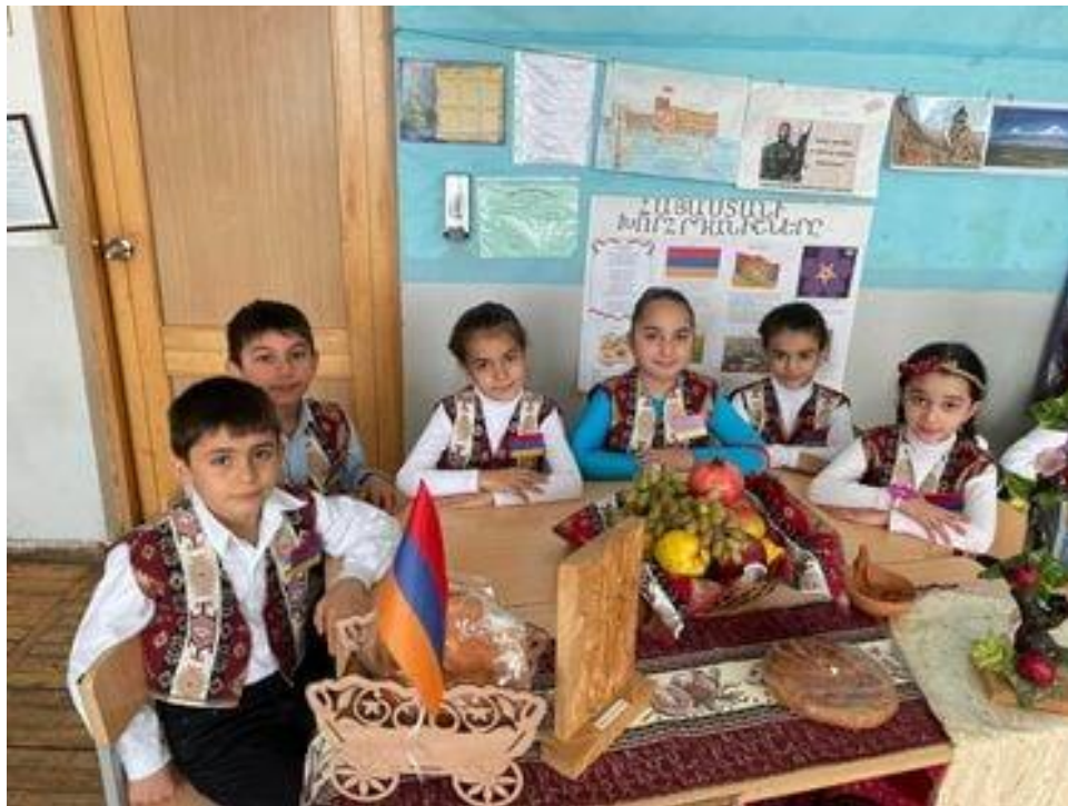
Հավելված 2(նկար 3)