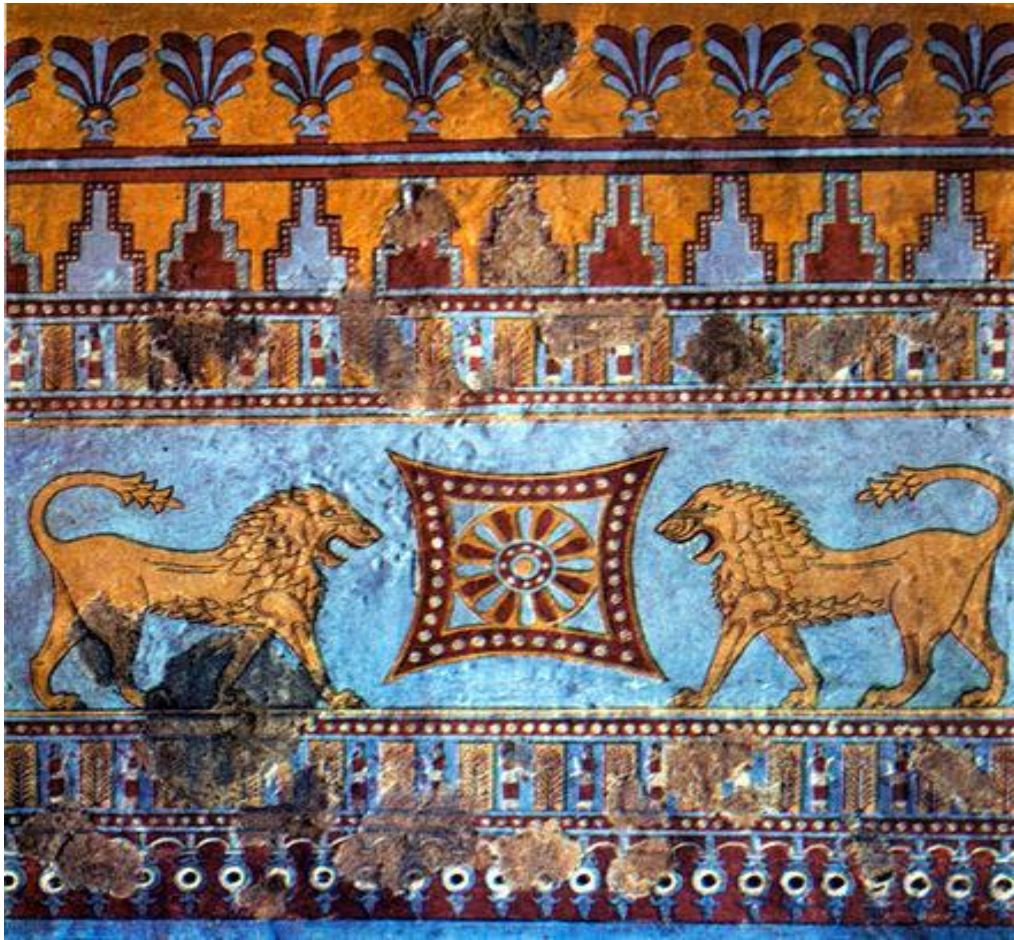
Էրեբունի ամրոցի որմնանկար (Մ. թ. ա. 8-րդ դար) [6]

քաղաքի միջնաբերդի շինություններից մեկում հայտնաբերվել են որմնանկարներ, որոնք հին արևելյան արվեստի հրաշալիքներ են: