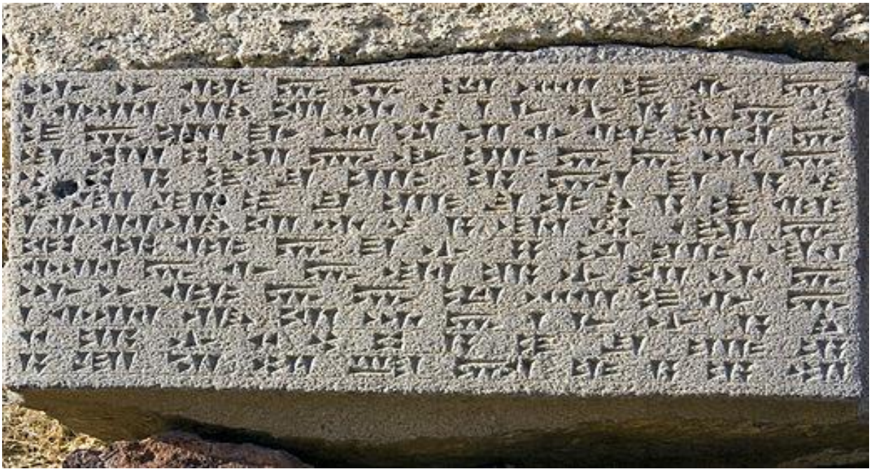
Ուրարտուի թագավոր Արգիշտի Ա-ի կողմից կառուցված Էրեբունի ամրոցի մասին կառուցման արձանագրություն [4]

Քաղաքային շինությունների քանակությամբ Ք.ա. 7-րդ դարի ուրարտական Ռուսա Բ թագավորը կառուցում է Թեյշեբահնի քաղաքը, կառուցված է Կարմիր բլուրի վրա և տարածվում է հզոր միջնաբերդից դեպի արևմուտք և հարավ ,նա ուներ ճիշտ հատակագծով փողոցներ, որոնք համապատասխանում են թաղամասերի և պարունակում բնակելի շենքերի տակ զանազանատիպ կոմպլեքսներ:Թեյշեբահնի քաղաքի բերդը զբաղեցնում է մոտ 4 հեկտար տարածություն և կազմված է շուրջ 150 սենյակից: Բլուրի գառիթափ լանջերին հարող շինության հյուսիսային և արևելյան ճակատներն անկանոն դասավորություն ունեին ,աստիճանաձև են ,որը համապատասխանում էր Կարմիր բլուրի մակերևույթին:Արևմտյան ճակատը բացվում էր բերդապարիսպով շրջապատված ընդարձակ բակի վրա,որ երկու մուտք ուներ,մեկը հարավային կողմից,մյուսը՝ հյուսիս-արևմտյան:Գլխավորը դրանցից առաջինն էր՝երկու աշտարակներով և ներսի շինությամբ լավ ամրացված, իսկ երկրորդը՝ մի փոքր դարպաս էր ,որի միջոցով սայլը կամ մարտակառքը կարող էր ազատ անցնել, իսկ անցորդների համար արված էր մի նեղ դռնակ :Գլխավոր մուտքը սալահատակված էր անկանոն ձևի հսկայական քարե սալերով,իսկ երկրորդը՝ գետաքարերով:Միջնաբերդի պարիսպները շարված էին չթրծված խոշոր աղյուսներից:Արտաքին պարսպի հաստությունը հասնում էր 3,5 մետրի ,իսկ ներքին պատերինը 2,1 մետրի: Միջնաբերդի անկյուններում վեր են խոյանում վիթխարի աշտարակներ:Տարբեր մասերում պարիսպների բարձրությունը տարբեր էր՝ 6-ից մինչև 12 մետրի,քանի որ բլրի ռելյեֆի պատճառով ամբողջ շինությունը աստիճանաձև տեսք ունի: Լուսամուտները հավանաբար , բազմազանությամ և