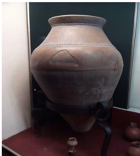
Կարաս, գտնվում է Էրեբունի պատմահնագիտական արգելոց-թանգարանում [7]

Վանի թագավորությունում լայն տարածում են ունեցել մեծ կարասները, որոնք օգտագործվել են ոչ միայն հեղուկների, այլև հացահատիկի պահպանության համար: Հացահատիկի համար նախատեսված կարասների հասակին միջանցիկ անցք է արված, որպեսզի հացահատիկը չխոնավանա: Կարասների նախշազարդերը խիստ բազմազան են : Կան ոլորված պարանի ձևի բարձրաքանդակ զարդեր կամ մեկը մյուսի վրա հենված եռանկյունիների գոտիներ: Հաճախ բարձրաքանդակի նախշը գուգակցվում է դրոշմված, քսված կամ փորագրված փայլին: