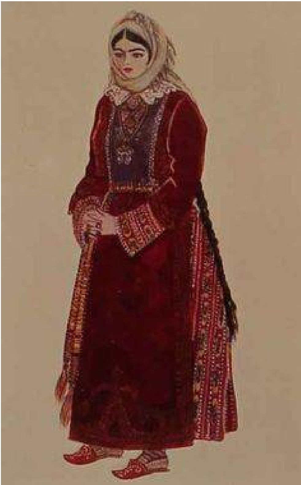
Armenian costume of Partsr Hayk - photos OVENK