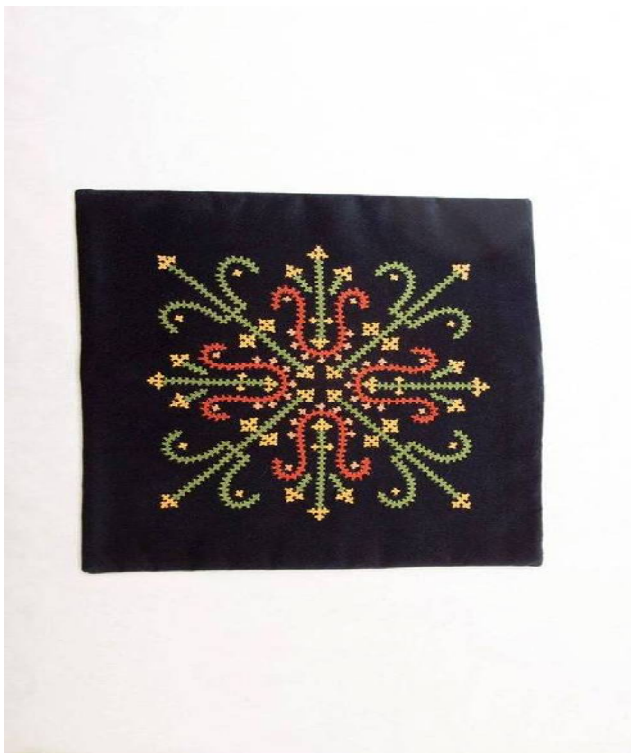
[ 8] նկ.4

Ինչպես դեկորատիվ- կիրառական արվեստի մյուս ճյուղերում , այնպես էլ ասեղնագործ արվեստում հանդիպում են երկրաչափական , բուսական , կենդանական, ինչպես նաև երկնային մարմինների երևակայական ձևերի պարզ ու բարդ բովանդակություն ունեցող զարդանախշեր , պատկերագրություններ [7]: