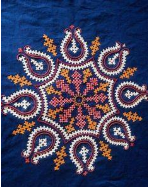
1 ] նկ. 6

կտորին և կտորի հակառակ կողմում իրար գուգահեռ ուղղություններով մանրիկ կարեր են երևում: Երբորդ և չորբորդ շարքերում ասեղն այլևս կտորին չի կպչում ,այլ միայն որոշակի հաջորդականությամբ հյուսվում է խաչմերում թելերին: Երբորդ շարքում ասեղն անցնում է միայն ասեղնագործության վերին մասով, այդ շարքն ավարտելուց աշխատանքը շրջելուց հետո դարձյալ ձախից աջ ուղղությամբ ասեղնագործում ենք չորբորդ շարքը. Այստեղ նույնպես ասեղնագործվում է վերին մասը:[10]