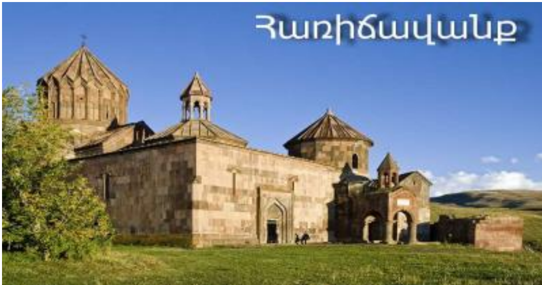
Սկար 3. Հառիճավանք

Հառիճավանքը միջնադարյան ճարտարապետության գոհարներից է՝ պարուրված նուրբ զարդաքանդակներով: Ծինությունը վեհաշուք է իր պարզությամբ և կառուցման կատարելությամբ: Դեռևս VII դարից սկսած վանքը եղել է նաև գիտակրթական կենտրոն: Ալփասլանի արշավանքների ժամանակ՝ XI դարում, վանքը կործանվել է, որը կրկին վերականգնվել է 1236 թ-ին: 1856-57 թթ-ին այնտեղ բացվել է կիսագիշերօթիկ դպրոց, որը 1872 թ-ին ունեցել է 63 աշակերտ, որոնցից 32-ը՝ գիշերօթիկ, 31-ը՝ երթևեկ: 1888թ-ին այն դարձել է երկդասյա դպրոց՝ 5 բաժանմունքով: 1896 թ-ին ցարական կառավարությունը փակել է դպրոցը, որը հետո վերաբացվել է 10 տարի անց: 1907 թ-ին դպրոցը դարձել է երկսեռ ծխական և ունեցել է 109 աշակերտ և 5 ուսուցիչ: 1913-14 ուս. տարում դպրոցը դարձել է վեցամյա, իսկ հետագայում՝ միջնակարգ: Վանքում գործող հայտնի դպրոցում՝ 1887-1889 թթ., սովորել է նաև հայտնի բանաստեղծ՝ Ավետիք Իսահակյանը: [21, էջ 243]