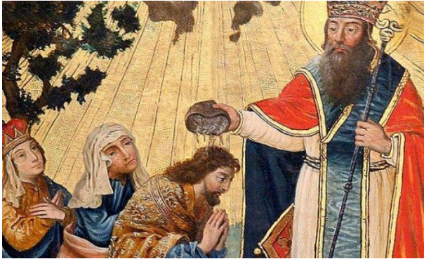
Ս. Գրիգոր Լուսավորչի ելքը Խոր Վիրապից

արքային ուղեկցող շքախումբը ծաղկեպսակներ և զոհեր են մատուցում Անահիտ դիցուհուն: Միայն քրիստոնյա Ս. Գրիգորը հրաժարվում է հեթանոս աստվածուհուն զոհեր մատուցելուց: Արքային վշտացնում է իր սիրելի քարտուղարի արարքը: Նա տարբեր միջոցներով փորձում է դարձի բերել Ս. Գրիգորին: Բայց վերջինս մնում է