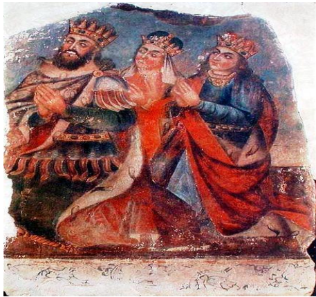
Տրդատ Մեծ թագավորը, Աշխեն թագուհին և թագավորի քույր Խոսրովիդուխտը

2. Ավանդությունների ներկայացում (Ս. Գրիգոր Լուսավորիչ: Ս. Հռիփսիմյան կույսերի նահատակությունը): Քրիստոնեությունը Հայաստանում պետական կրոն