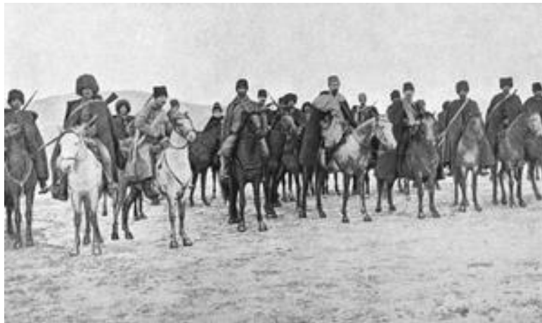
Հայ կամավորականները Առաջին համաշխարհային պատերազմում: Ջոկատի շտաբը. Խեչո, Դրո, Արմեն Գարո:

Ուսուցիչը առանձին ներկայացնում է Ռուսաստանի և Հայաստանի շահերի համընկնումը, որի համար վերհիշել է տալիս «Հայոց պատմություն» առարկայից անցած գիտելիքները: Ռուսաստանը այդ ժամանակ ծրագրել էր իրականացնել իր դարավոր նպատակը՝ գրավել Բոսֆոր ու Դարդանել նեղուցները և դուրս գալ Միջերկրական ծով, ինչպես նաև գրավել Արևմտյան Հայաստանը և ամուր հաստատվել Մերձավոր Արևելքում: Արդյունքում՝ Օսմանյան կայսրությունը պետք է մասնատվեր: Ինչպես տեսնում ենք, հայ ժողովրդի շահերը համընկնում էին իր ռազմավարական դաշնակցի շահերի հետ, որի պատճառով էլ հայերը պատերազմեցին Կովկասյան ճակատում ռուսական բանակի կազմում: Նշանակալի է նաև ֆրանսիական բանակի կազմում հայերի մասնակցությունը: