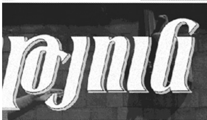
«Кртутун» еженедельник 05.10.2005թ. չորեքշաբթի թիվ 28 (175)

Բիայնիլի-Վան, Երեւոնի-Երեւան... Քանի՞ դար կա այս անցումների միջեւ... Նախիջեւան-Երեւան-Իջեւան... Ե՛րբ է Նոյն անցել այս ուղերթով...