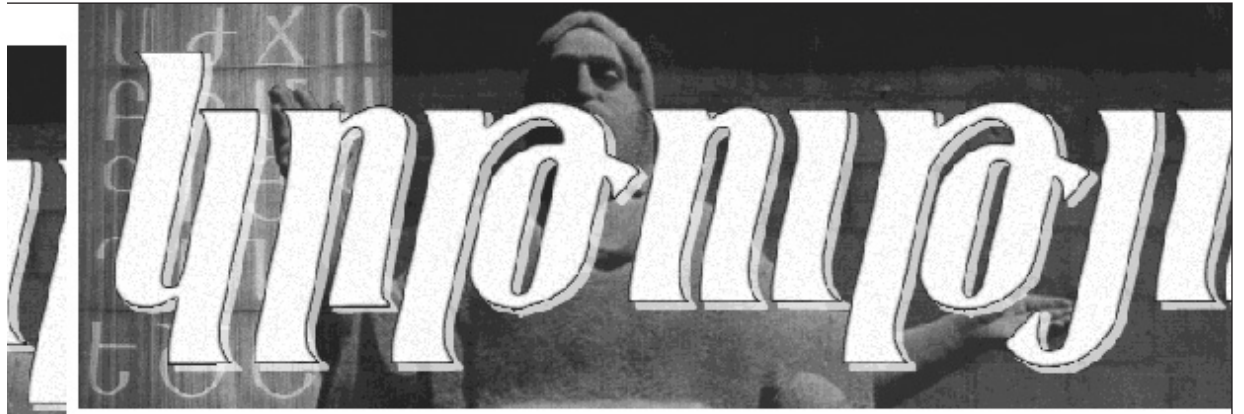
Շաբաթաթերթ «Кртутун» (education) weekly «Кртутун» (образование) еженедельник 12.10.2000

Այլ մանրամասնությունների համար կարող եք դիմել «Հայփոստի» (51-45-47), «Հայմամուլի» (45-82-00) եւ այլ գործակալությունների այն մասնաճյուղերին, որտեղ կատարում եք բաժանորդագրությունը: