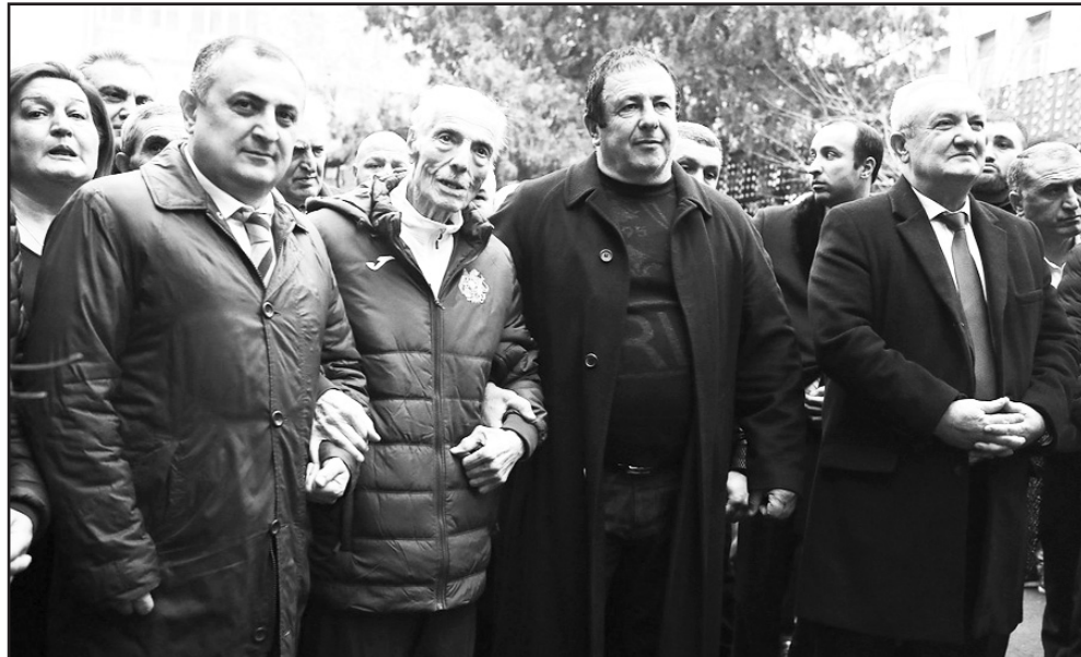
յանի արձանն էր տեղադրվում:

Կենդանի լեգենդ Ալբերտ Ազարյանի բրոնզաձուլ կիսանդրու հեղինակը քանդակագործ, Հայաստանի նկարիչների միության անդամ Գերասիմ Շահվերդյանն է: Ասում է կիսանդրին ստեղծելու առաջարկը ստացել էր վաղուց՝ 2013 թվականին, երբ անվանի մարմնամարզիկ Յրանտ Շահին-