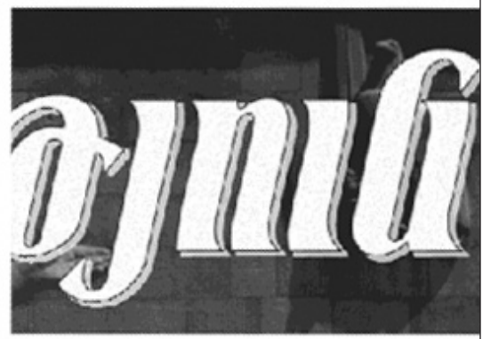
«Кртутун» еженедельник 18.08.2005թ. հինգշաբթի թիվ 21 (176)