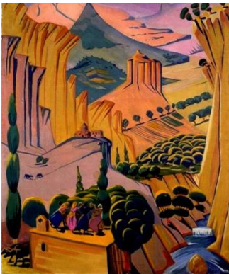
"Armenia" Martiros Saryan